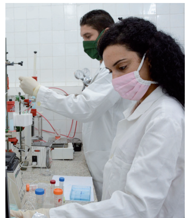
La juventud marca la vanguardia en los resultados científicos del territorio.