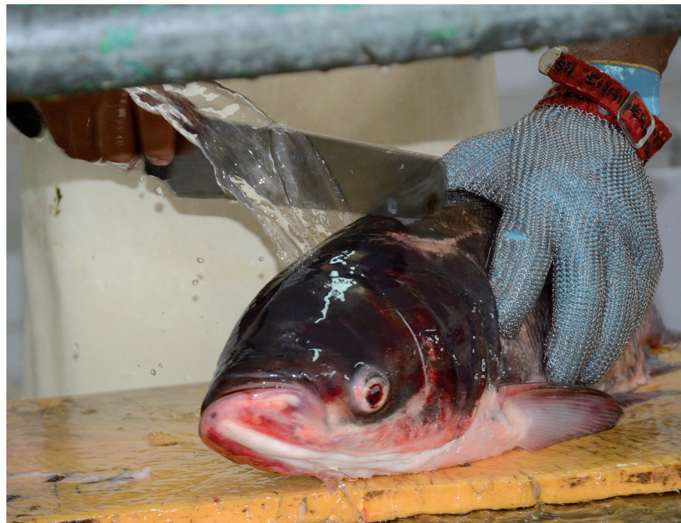
La industria pesquera espirituaña labora para reducir los costos productivos.