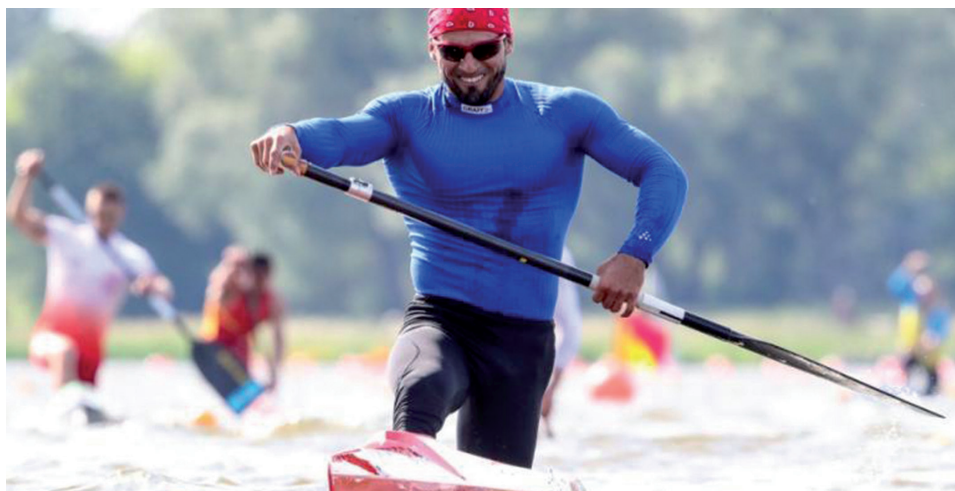
El canoísta espiritano remarará más seguro en sus próximas competencias.

Hasta ahora solo está el anuncio, la noticia dicha en medio de una amalgama de sucesos, sin más detalles del proceso. Mas, valga esta intención de brazos y puertas abiertas en momentos en que Cuba necesita de sus cubanos todos, peloteros o no, al menos de quienes la quieran como es, con sus defectos, carencias y virtudes.