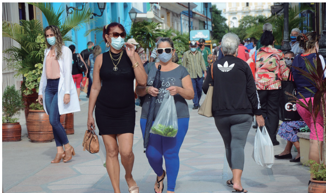
Ante la compleja situación epidemiológica del territorio urge aumentar la percepción de riesgo.

En los últimos seis días se han confirmado en la provincia 209 espirituanos contagiados. La tasa de incidencia de casos confirmados se ha ido elevando a 78.0 por 100 000 habitantes