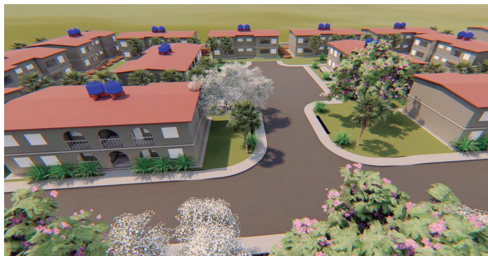
Así quedará el medio centenar de inmuebles para los pobladores de las zonas costeras espirituanas.