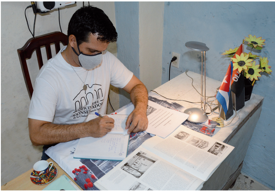
El trabajo a distancia ha devenido opción para jóvenes de diversas entidades espirituanas.

Los jóvenes espirituanos son protagonistas en cada frente de trabajo para el desarrollo de la nación