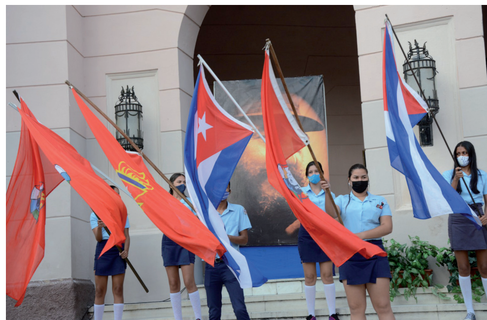
Los jóvenes espirituanos son verdaderos protagonistas de las batallas de estos tiempos.