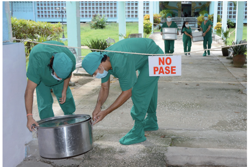
Los universitarios han acudido al llamado de asumir disímiles misiones en las zonas rojas.