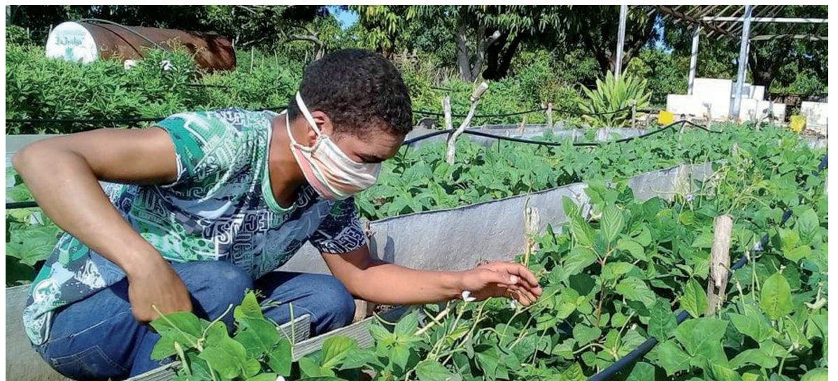
La sangre joven ha abonado la tierra para obtener los alimentos que demanda el pueblo.