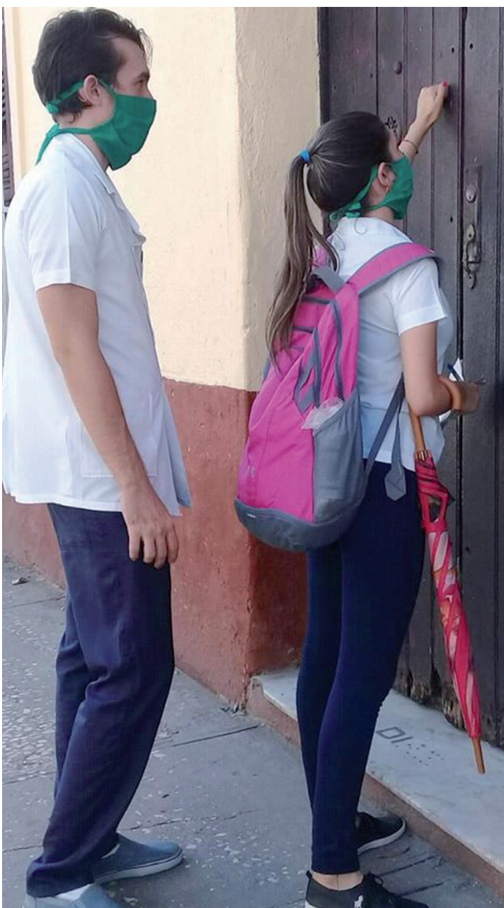
Estudiantes de Ciencias Médicas han resultado baluartes para enfrentar la COVID-19 con las pesquisas activas en la comunidad.