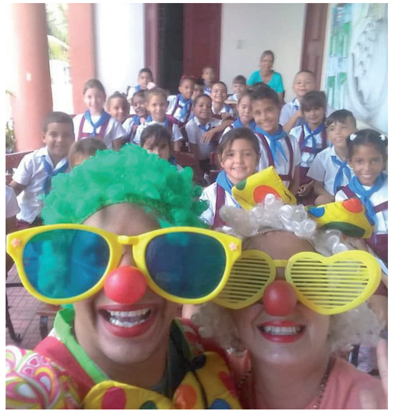
También la AHS anunció que este domingo publicará en las redes sociales fotografías que evidencian sus estrechos vínculos con la OPJM.