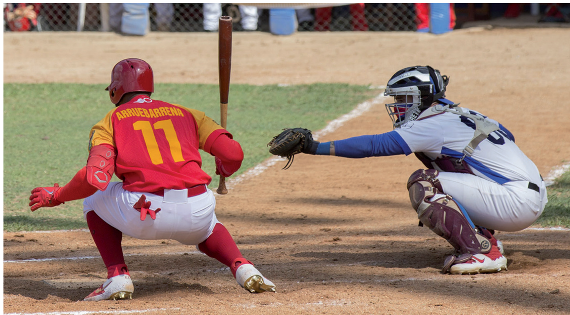
Varios exjugadores de las Grandes Ligas han retornado a jugar en la isla.

Hay que despejar aún demasiadas incógnitas y poner los pies sobre la tierra. Hay que cuidar la