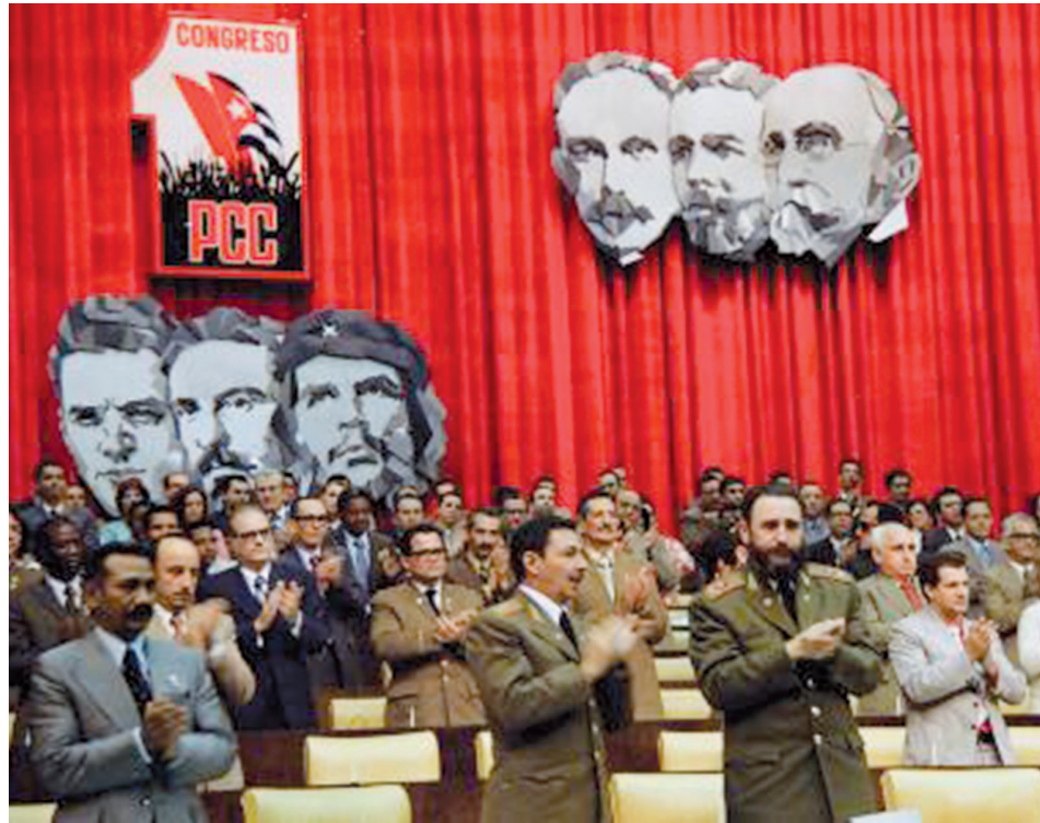
En el Congreso Fidel y Raúl fueron elegidos como Primer y Segundo Secretario del Comité Central del Partido, respectivamente.