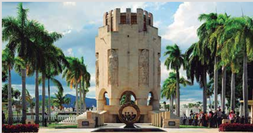
Infografía: Enrique Ojito y Yanina Wong / Fuentes: Juventud Rebelde, Radio Grito de Baire, Radio Majaguabo y Oficina del Conservador de la Ciudad de Santiago de Cuba

Al atardecer del 26 de mayo, arriba el cadáver a Santiago de Cuba. De inmediato, lo trasladan al cementerio Santa Ifigenia, donde es inhumado al día siguiente por segunda ocasión, en particular en el nicho 134, galería sur. La tercera exhumación acontece el 24 de febrero de 1907, cuando los restos son ubicados en el Templete, al ordenarse la demolición de los antiguos nichos. El 8 de septiembre de 1947 los sepultan nuevamente; en este caso, en el Retablo de los Héroes, debido al proceso de construcción del actual mausoleo, donde los restos mortales descansan de forma definitiva desde el 30 de junio de 1951, bajo la mirada de los rayos del sol.