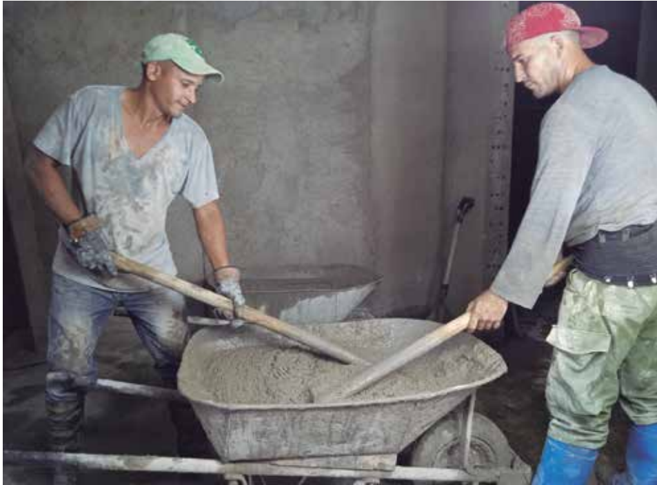
Las acciones emprendidas incluyen el incremento de un cuarto salón de operaciones destinado a la cirugía de emergencia.

Esta figura entre las obras constructivas del sector de la Salud de la provincia, ascendentes este año a cerca de 69 millones de pesos. Contribuirá a mejorar la infraestructura y atender a un mayor número de pacientes