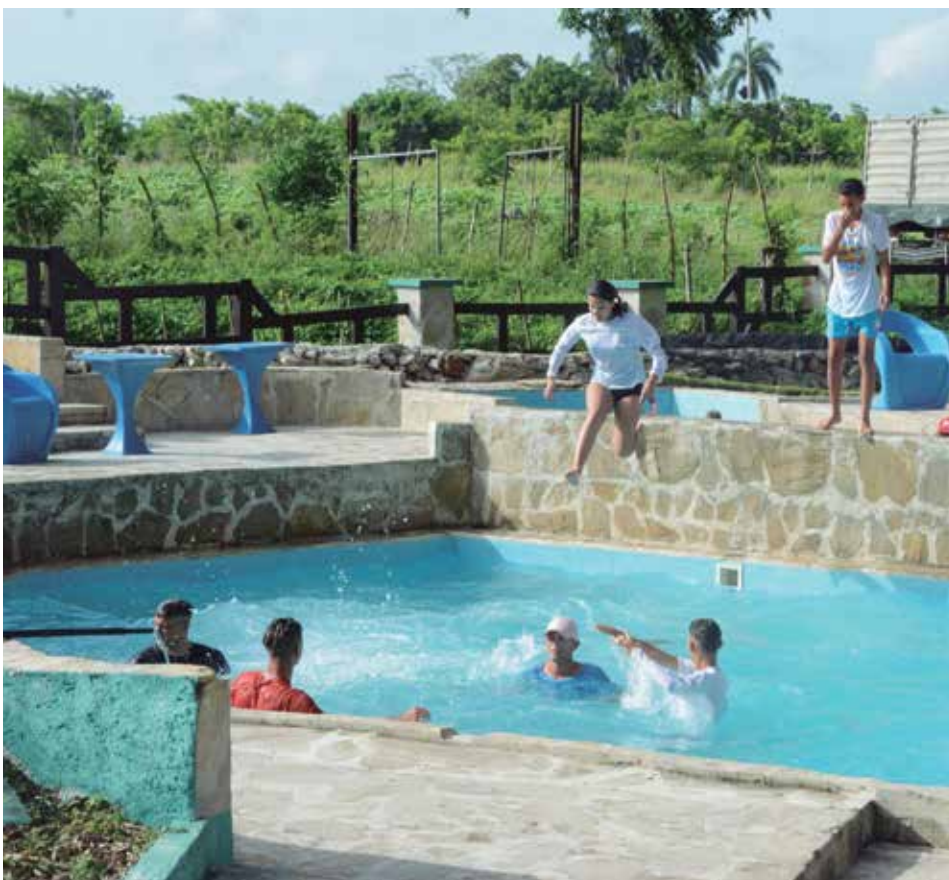
La opción de pasadías es muy demandada por los residentes en el norte de la provincia.

Esa, quizás, sea una de las razones por las que la finca se ha posicionado dentro de los principales destinos del turismo internacional procedente de los cayos del centro-norte de Cuba como un paseo que bien vale la pena disfrutar.