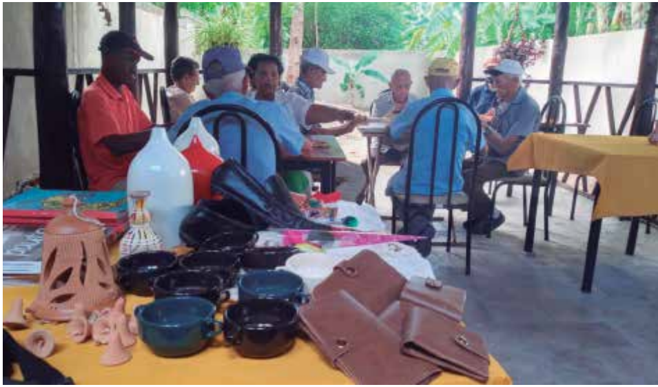
Calzado, billeteras y otros objetos forman parte de la donación.