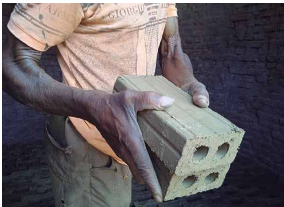
Miles de ladrillos han salido de sus manos.

“Este trabajo también es bonito, periodista, y qué bueno que ha venido, porque de los horneros nunca se habla”.