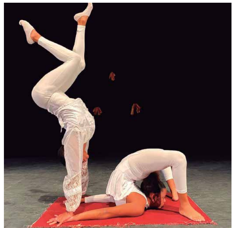
Este espectáculo ha llegado a varias provincias.

El cronograma de presentaciones en la céntrica Sala Yara, de Sancti Spíritus, incluye este fin de semana funciones dobles, cuyos horarios varían en dependencia de las afectaciones del servicio eléctrico en el circuito 112. (L. G. G.)