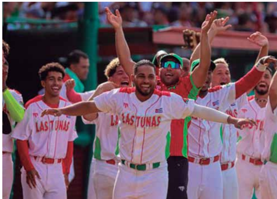
Los tuneros lucharon con garra el título del campeonato.

La Serie Nacional terminó “fatigada”. Por eso deberá reevaluar cómo retomar su calendario de antaño, que generalmente iniciaba en noviembre y solía concluir en marzo y abril, cuando el sol no es tan violento y hace menos estragos que los vistos ahora con varios jugadores afectados en pleno terreno. Por ahí debe comenzar su proyección, sin replegarse a los dictados del calendario internacional, que a tantos cambios nos ha llevado y que ahora solo convoca al béisbol en general muy poco, mucho menos al nuestro. (E. R. R.)