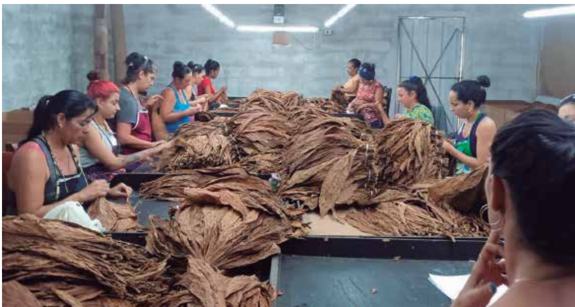
La escogida se integra al proyecto para cerrar el ciclo del proceso del tabaco en la propia finca.