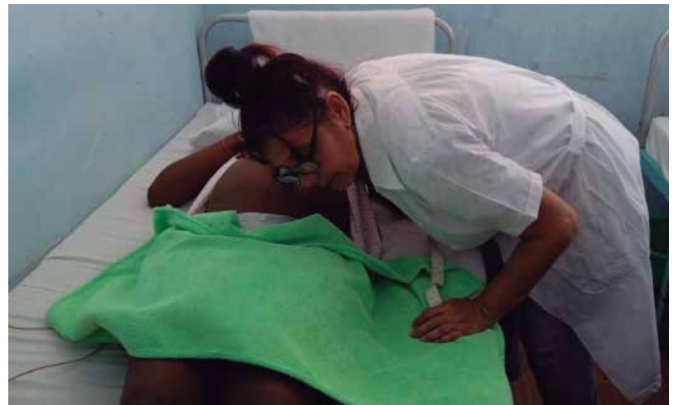
Aquí las embarazadas reciben todas las atenciones necesarias, refiere la doctora Eloísa.

Con estos conocimientos, las 15 embarazadas que permanecen hoy en el Hogar Materno Municipal de Yaguajay recibirán en mejores condiciones el momento del parto.