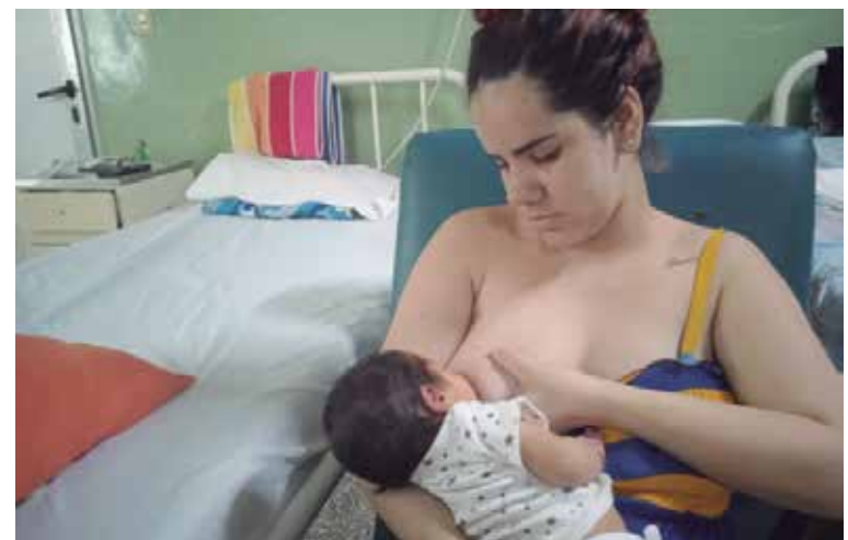
Esta vía de alimentación fomenta el desarrollo sensorial y cognitivo del niño, además de protegerlo de múltiples enfermedades.

“Tenemos que ser vigilantes en los hogares para que no se abandone la lactancia materna, porque sin ella no hay salud. Es la primera vacuna de un niño al nacer”.