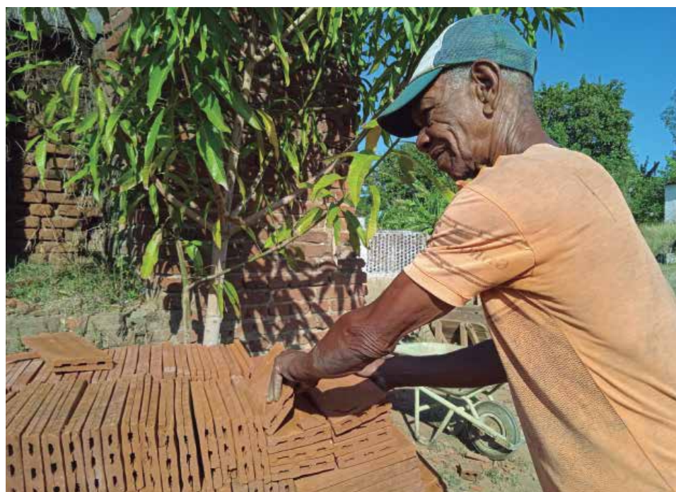
Este hombre está considerado un maestro de generaciones de alfareros.