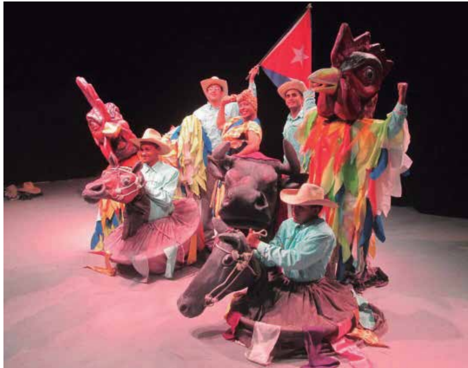
En sus tres décadas de existencia ha formado a más de 30 personas en el mundo del teatro.

Obra a obra, Teatro Garabato ha desbrozado caminos y apartado malezas para subir a lo más alto del escenario espirituario. Lo confirman muchas puestas es escena, entre las que nunca podrán dejarse de mencionar