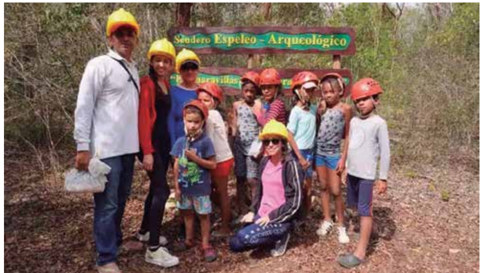
Los valores naturales del sitio atraen a visitantes cubanos y extranjeros.

El Parque Nacional Caguanes, situado al norte de Sancti Spiritus, es un área protegida de 20 490 hectáreas, repartidas en terrestres y marinas, las cuales sobresalen por su biodiversidad.