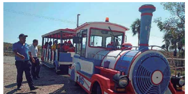
Durante su itinerario, el tren hace varias paradas en sitios atractivos del territorio.

El tren turístico tomó carretera desde los primeros días de abril de 2023 y desde esa fecha hasta la actualidad el producto ha tenido una alta demanda entre visitantes nacionales y extranjeros.