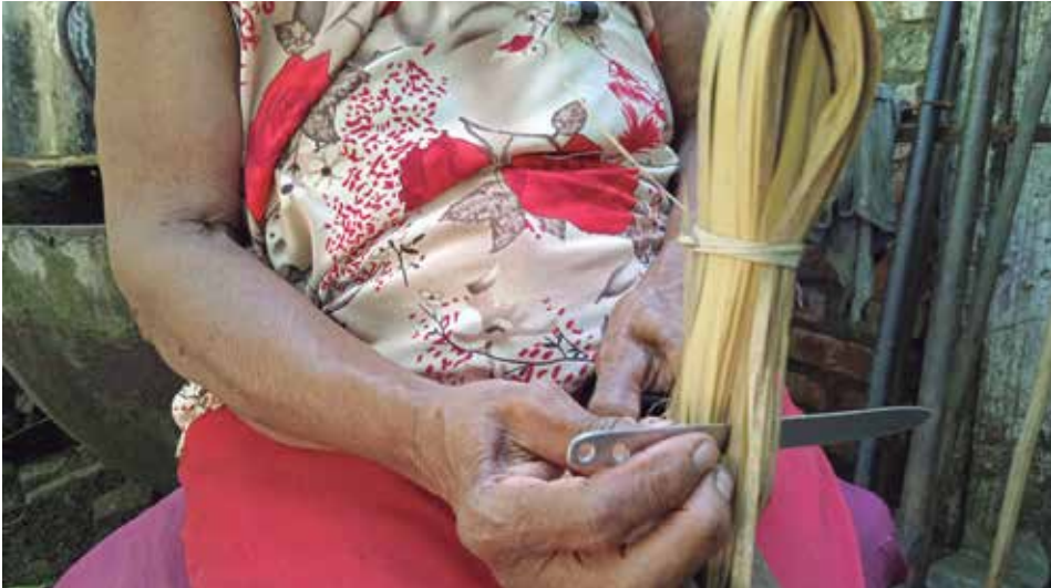
Con 77 años esta artesana teje escobas y otros útiles para los campesinos de la localidad.