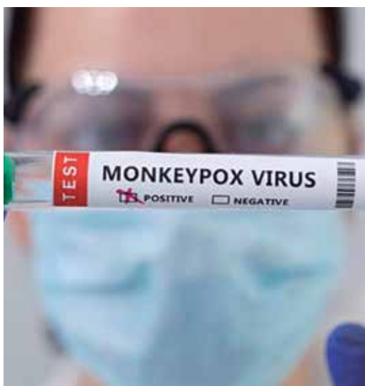
La viruela símica (mpox) se transmite entre personas por el contacto físico directo con las lesiones de la piel.

Cada municipio cuenta con el aseguramiento necesario para que, en el complejo contexto económico del país, el fin del verano pueda celebrarse con iniciativas y propuestas diversas.