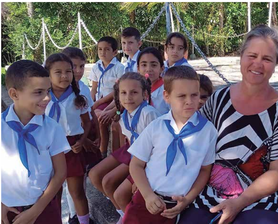
Miles de niños del territorio vuelven a sus escuelas este 2 de septiembre.

Las aulas espirituanas recibirán 65 783 estudiantes en todos los niveles educativos. Funcionarán 463 centros escolares a los que se suman otras instituciones del sector