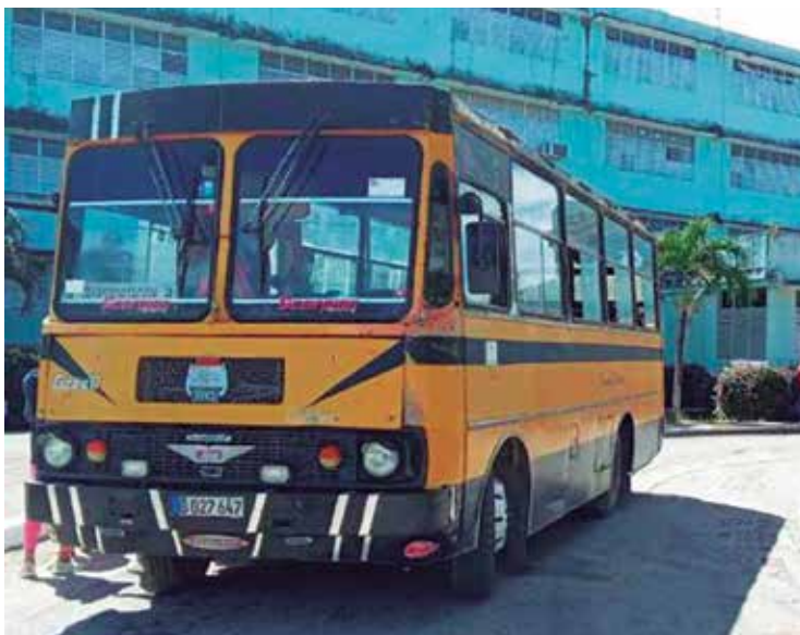
Para atenuar las limitaciones de combustible, se apelará a utilizar mejor las capacidades de transportación.