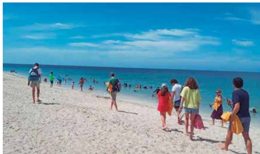
Visitantes de varias provincias han disfrutado de las playas trinitarias.

El virus entra en el cuerpo mediante diferentes vías: las heridas o rasguños en la piel, las mucosas (genital, ojos, nariz y boca) y el tracto respiratorio, refieren los especialistas.