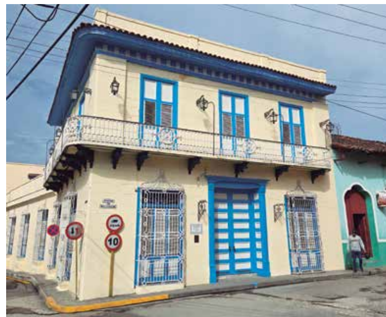
El Museo de Arte Colonial de Sancti Spíritus forma parte de la historia de esta mujer.