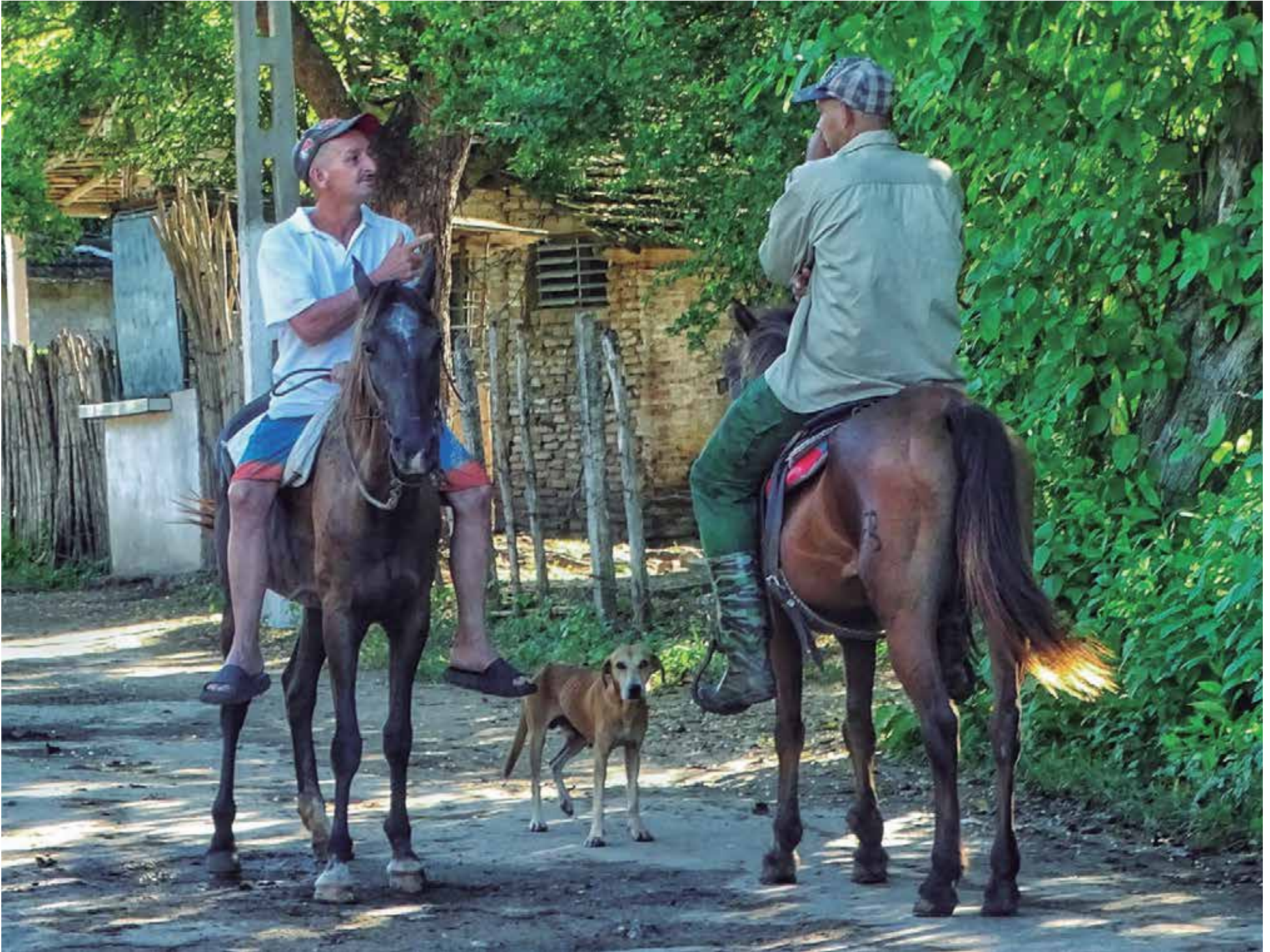
El poblado está ubicado a poco más de 30 kilómetros de la ciudad de Trinidad.