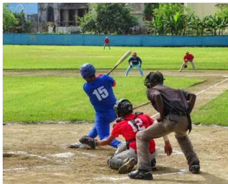
Este fin de semana comienzan las acciones en Tuinucú.