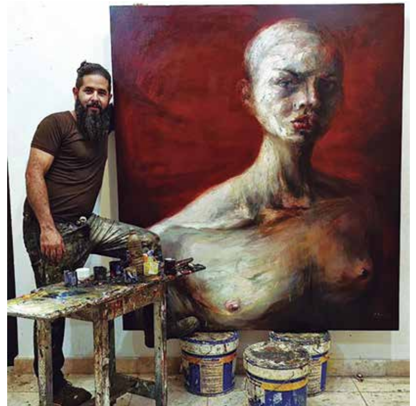
Cada pieza de Yasiel se convierte en una provocación.

“Igual hay que hacer espacio a otros proyectos en que trabajo, vinculados a ferias internacionales de arte en Estados Unidos y Europa. Por el momento, casi a la par estarán mis creaciones por Portugal y en Art Madrid, a donde llegarán por tercera ocasión”, declaró en exclusiva. (L. G. G.)