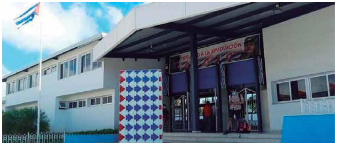
A partir del cambio se concentrarán dos servicios fundamentales: reservación y Última Hora.

“Lo que se quiere es que con los ingresos en efectivo que reciben las bodegas, mercados y demás establecimientos, se pueda prestar el servicio de pago por Caja Extra (con una cuantía de hasta 5 000 pesos, en dependencia de los niveles de entrada de saldo al establecimiento durante el día); esta es una forma de facilitar a las personas extraer efectivo sin tener que acudir a los cajeros electrónicos o los bancos”, aclaró Fernández Martín.