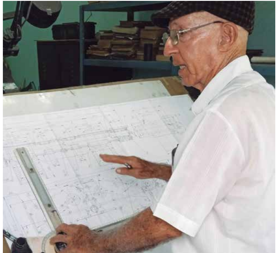
A la hora de hacer un proyecto, el innovador afina hasta el más mínimo detalle.

Por ejemplo, una de las inventivas de gran impacto en la sustitución de importaciones es la caja sostén de los ejes cortadores de la cosechadora cañera Case. Llevó muchos días para elaborar la idea, plasmarla en el