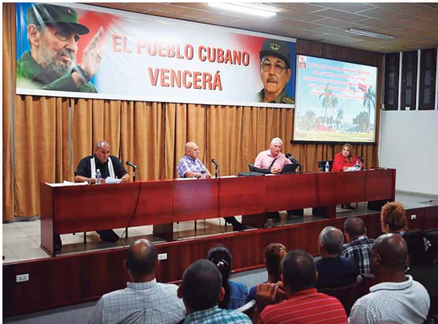
“Ya podemos hablar de discretos avances en la economía”, expresó el presidente cubano.