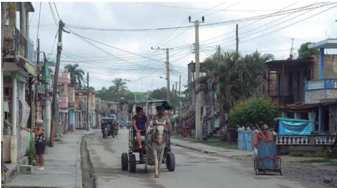
El Consejo Popular Kilo-12 es uno de los más amplios de la ciudad espirituaña.