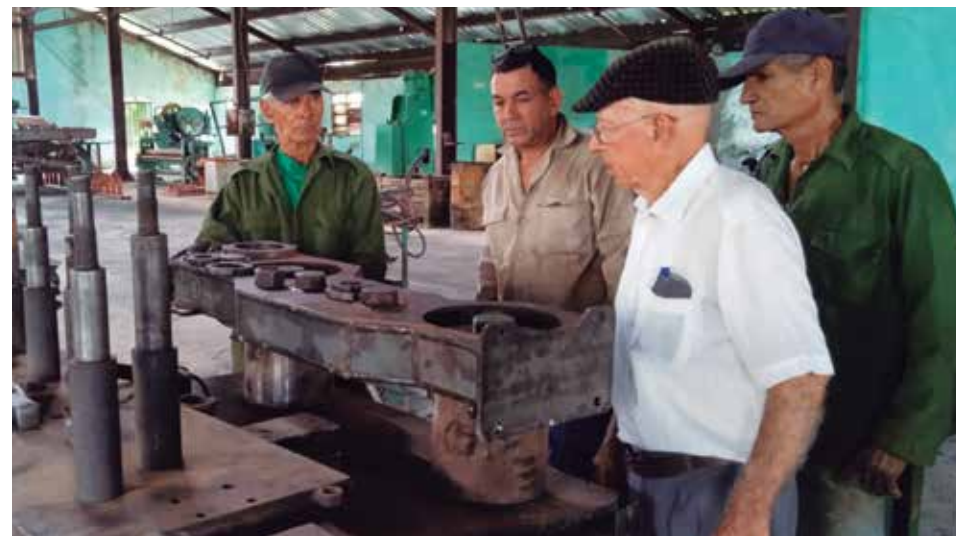
La caja sostén de los ejes cortadores de la combinada cañera Case, inventiva llevada a más de 100 máquinas en el país.

Una persona tranquila, casado, tengo dos hijas, una estomatóloga y otra licenciada en Matemática, tengo nietos estudiando en diferentes enseñanzas; en general la familia se comporta de forma normal y eso me basta. Soy un enamorado de Cuba, por eso hago todo lo que esté a mi alcance sin mirar la edad, he vivido para trabajar, es lo mejor que se puede hacer. No es asunto de si me quedan bríos a los 79 años para pensar e innovar, es que no puedo vivir sin este trabajo, el organismo se me enfermaría.