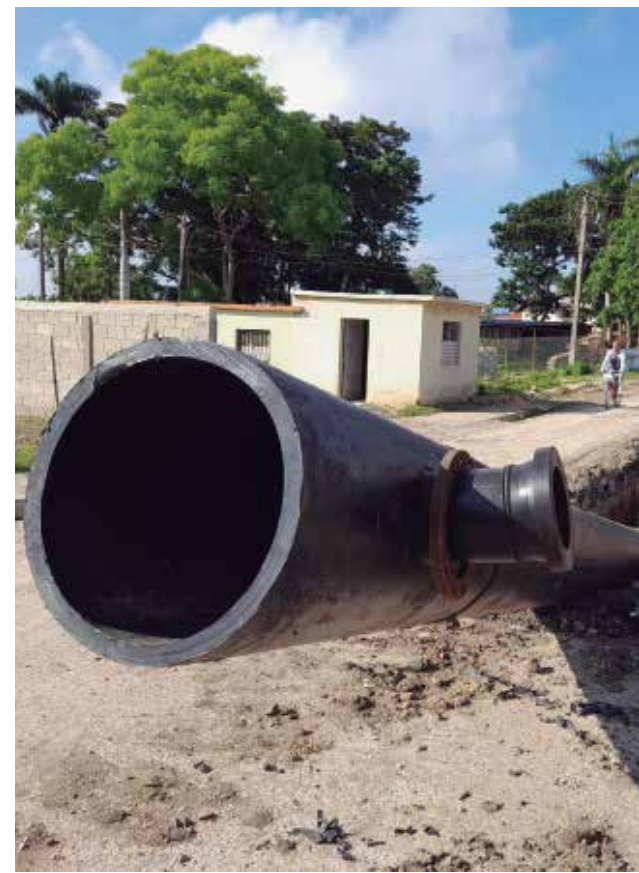
Actualmente se trabaja en el cruce de la Carretera Central.

Para la obra emplean tuberías de polietileno de alta densidad, material reconocido por su extensa vida útil, a diferencia de las fabricadas con acero u hormigón.