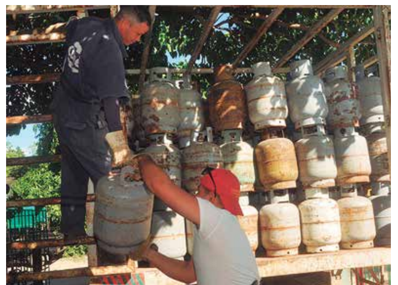
El servicio de mensajería se extiende poco a poco a varias provincias cubanas.

Inicialmente, el servicio solo se ofertará dentro del perímetro