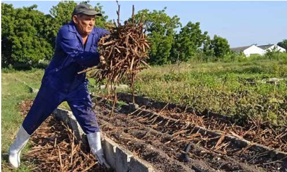
Hoy el Gigante no cuenta con áreas de cultivo semiprotectido.

La mayor infraestructura de la Agricultura Urbana en Sancti Spíritus enfrenta otra fase de recuperación productiva en busca de superar el estancamiento y encontrar el camino de la sostenibilidad