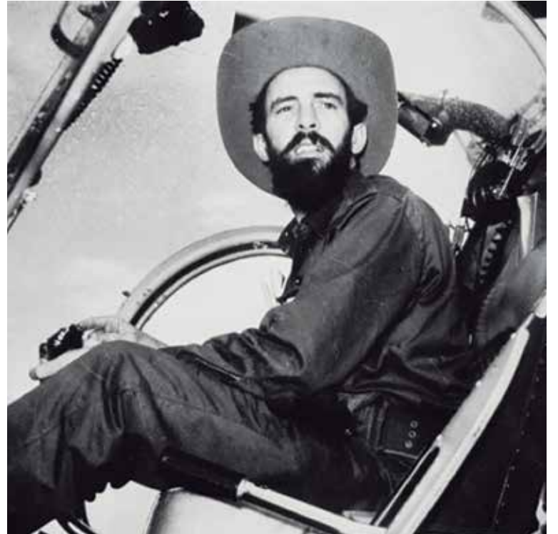
Luego del triunfo de la Revolución, Camilo se desempeñó como jefe del Estado Mayor del Ejército Rebelde.

popular ha sido más volandera que jamás —también exponía el diario del M-26-7—. Las ‘bolas’ nacían y se extendían con increíble rapidez. (...) Pero tras las ‘bolas’, conjeturas y discusiones había una verdad latente: el pueblo seguía teniendo esperanzas. El pueblo se negaba a admitir con simplicidad lo que en el fondo él mismo temía: la tragedia. (...) en la sencillez del héroe veíamos conjugadas todas las virtudes de nuestro pueblo. Porque Camilo posee algo que no es posible describir ni analizar. Un algo inexplicable y presente y que García Lorca definió con tener ‘ángel’. Y eso que no es posible describir, ese inexplicable en Camilo lo ha convertido en algo así como el ‘ángel de la Revolución’”.