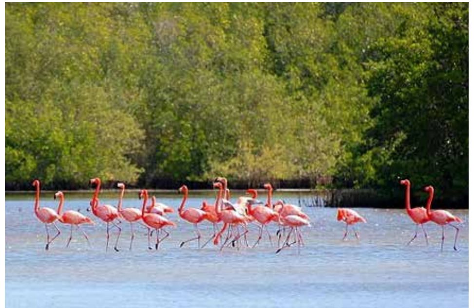
El Parque Nacional Caguanes constituye un área protegida de singular belleza.

En este evento internacional de ciudades creativas Trinidad mostró obras de lencería de preciosa factura confeccionadas por maestras artesanas locales.