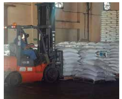
Unas 110 toneladas de azúcar se trasladarán hasta los almacenes de la EMPA.