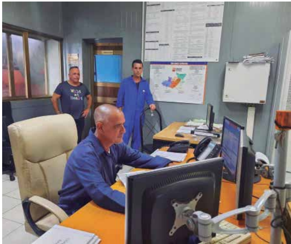
En el Despacho Eléctrico Provincial se trabajó sin descanso.

La alternativa se multiplicó. Allí donde se pudo encontrar o se repartió como en Cabaiguán casi una lata por casa, se cocinó con carbón. También con leña, con charamus-