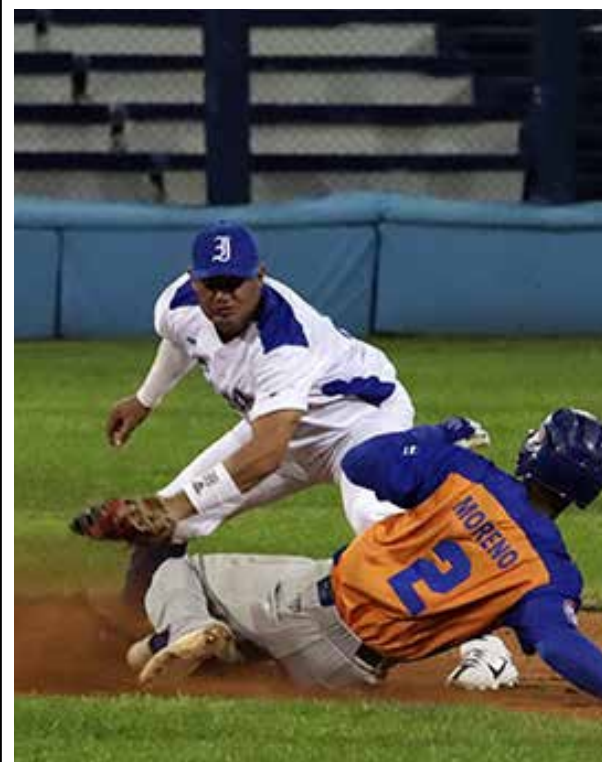
Para continuar el camino del rescate del béisbol es necesario fortalecer la Serie Nacional.

No son iguales las realidades, pero para seguir en el camino del rescate de la esencia del béisbol se ha de comenzar por fortalecer su principal certamen.