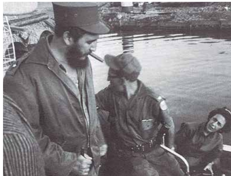
Fidel dirigió personalmente la operación de búsqueda del Héroe de Yaguajay.