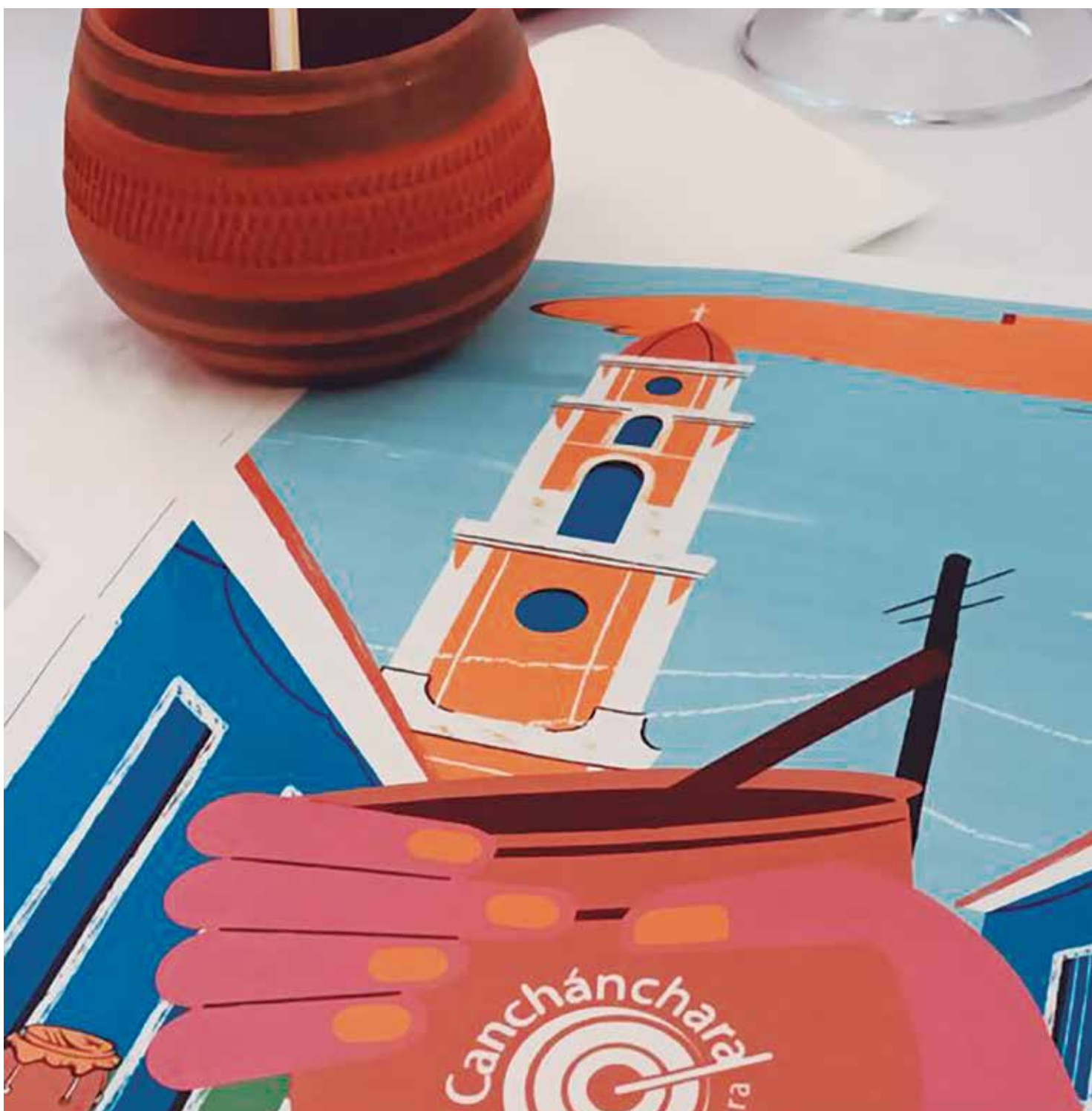
Exposiciones de artes plásticas, ferias artesanales y gastronómicas forman parte del programa del evento.

Por estos días los trinitarios podrán disfrutar, junto al auténtico coctel, de la actuación de artistas reconocidos como Vania Borges, Arlenys Rodríguez, Issac Delgado, Alain Pérez, Diván y la orquesta de Adalberto Álvarez y su Son, entre otros.