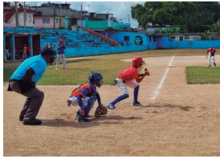
Un atractivo espectáculo brindó el torneo de los pequeños.

Y vuelve a correr con los "kilovatios" propios de su edad. Se me antoja repartir una medalla enorme para esta fiesta en que se ha convertido esta liga de campeones, capaz de destilar la más amigable de las rivalidades, tatuada en los rostros tristes de los fomentenses, en la sonrisa interminable de los espirituanos, en las lágrimas confundidas de los dos equipos. (E. R. R.)