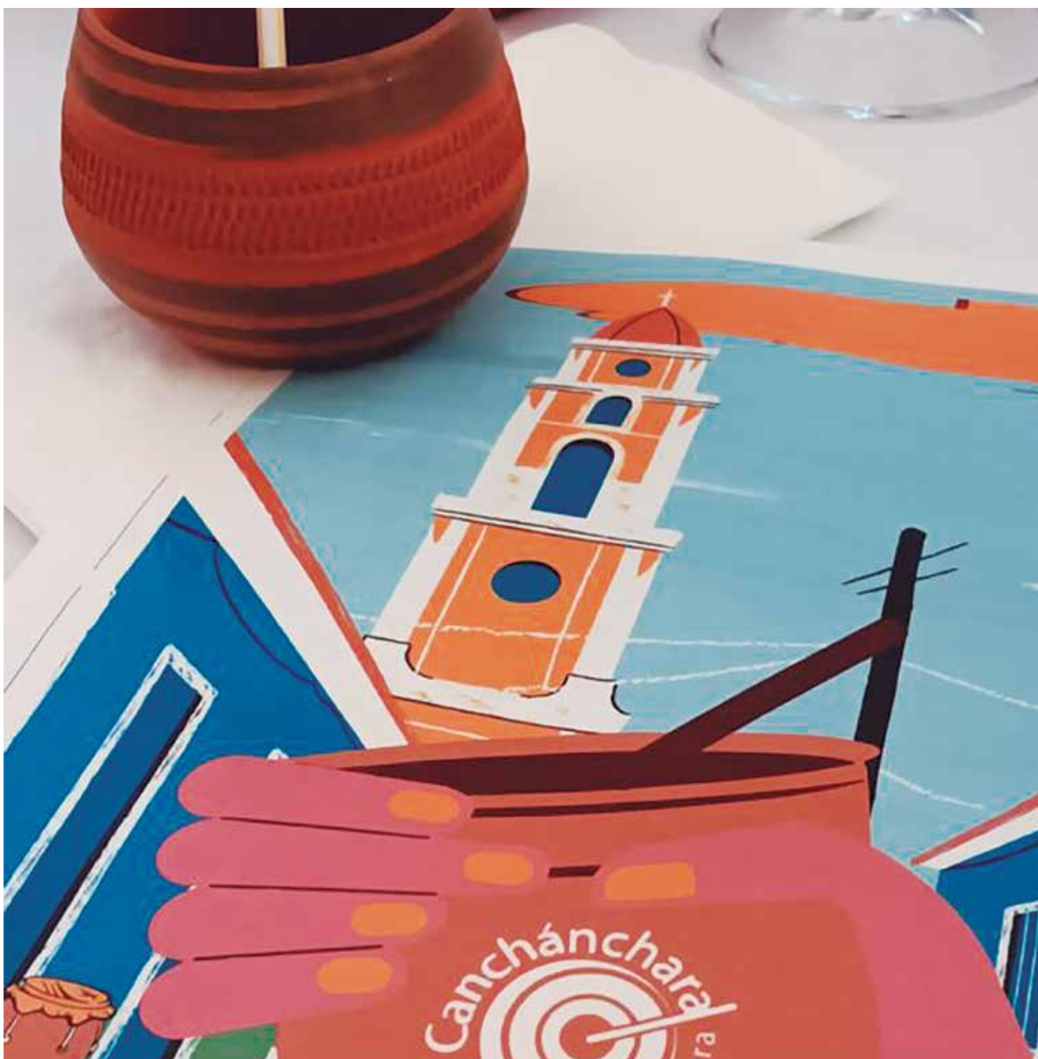
Exposiciones de artes plásticas, ferias artesanales y gastronómicas forman parte del programa del evento.