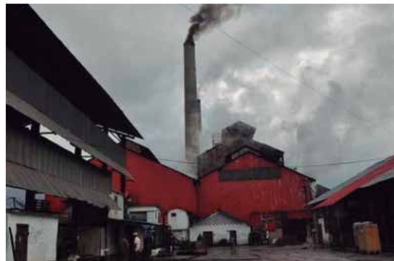
El central de Tuinucú es el único que molerá en la provincia.

El compromiso es mayúsculo: fabricar la más de 19 000 toneladas del crudo comprometidas hasta el 11 de marzo, una fecha tan utópica como el plan de aprovechamiento de la norma potencial del 70 por ciento, índice que hace años no logra y que en la pasada campaña fue apenas del 25 por ciento.