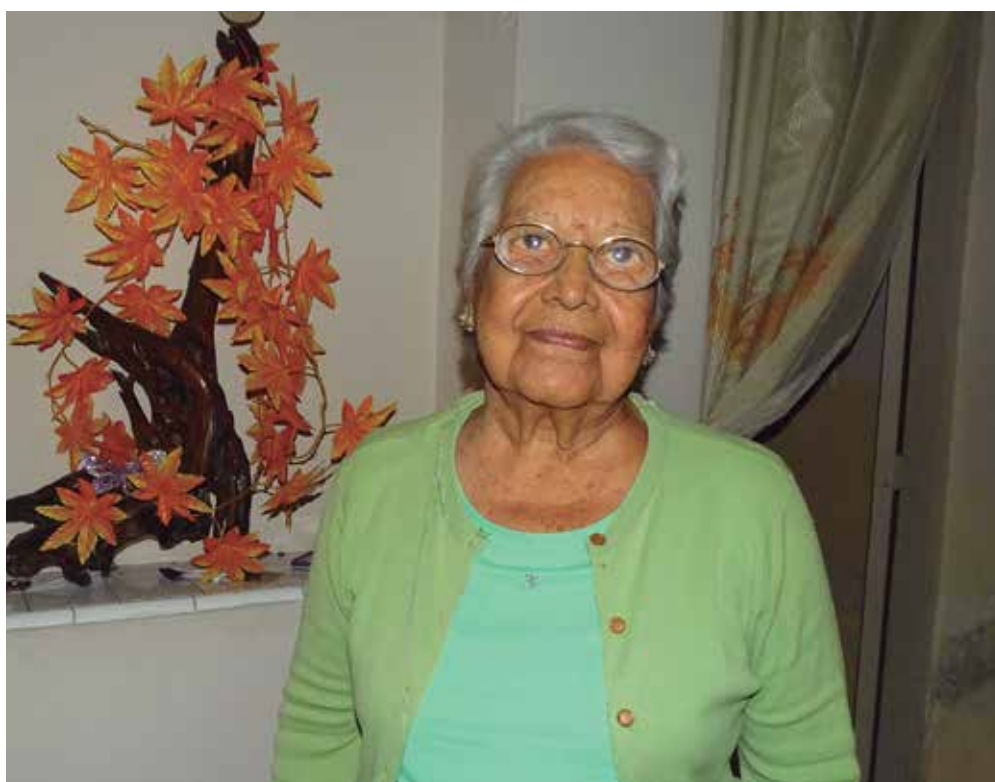
Muchos la recuerdan jaranera, sonriente en cada momento, cariñosa, humilde y muy profesional.

“Para mí ha sido un honor, un orgullo, disfruto mi profesión, doy todo lo que soy, lo que tengo y lo que sé a mis pacientes. Soy enfermera todo el tiempo y en cualquier circunstancia”.