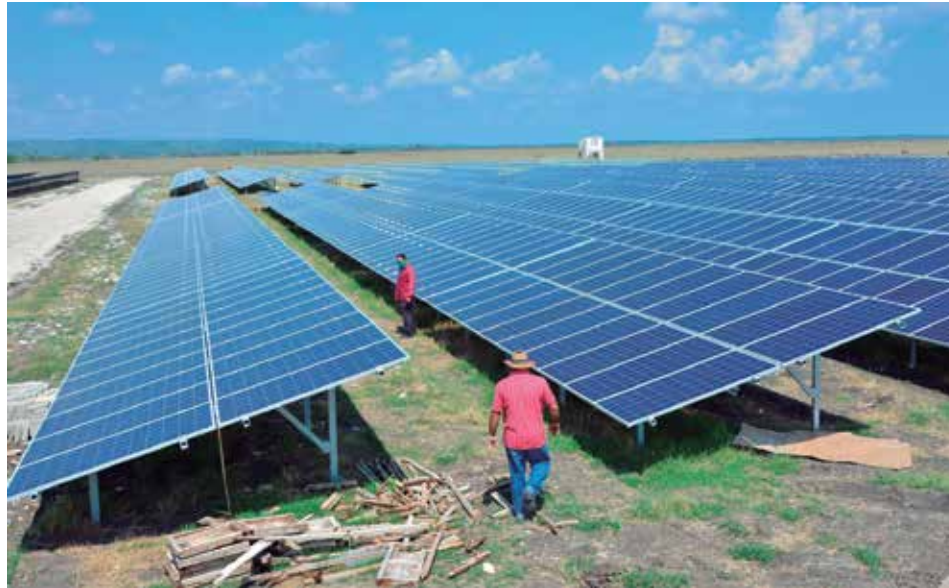
En el 2015 comenzó la construcción de parques solares en la provincia.

Principalmente se debe a las crisis que existe con los altos precios del combustible.