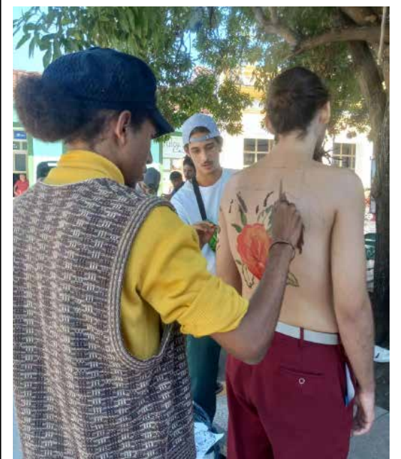
Diversas opciones culturales tienen lugar cada año en el contexto del evento.

Con sus luces, las Lunas de Invierno en esta XVIII edición rompe un tanto con la pasividad de los fines de semana. Se disfrutan así, en algunas de las principales calles de la ciudad, expresiones de lo mejor del arte joven de vanguardia. (L. G. G.)