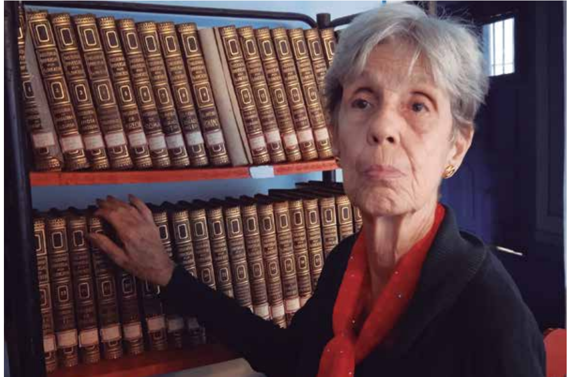
Ñeñeca pasa la mayor parte de su tiempo entre los libros del Centro de Documentación del Museo Provincial de Historia.

Bajo la mirada del Escudo de la Ciudad de Sancti Spíritus, reconocimiento que recibió hace años y decidió colgar en una de las paredes