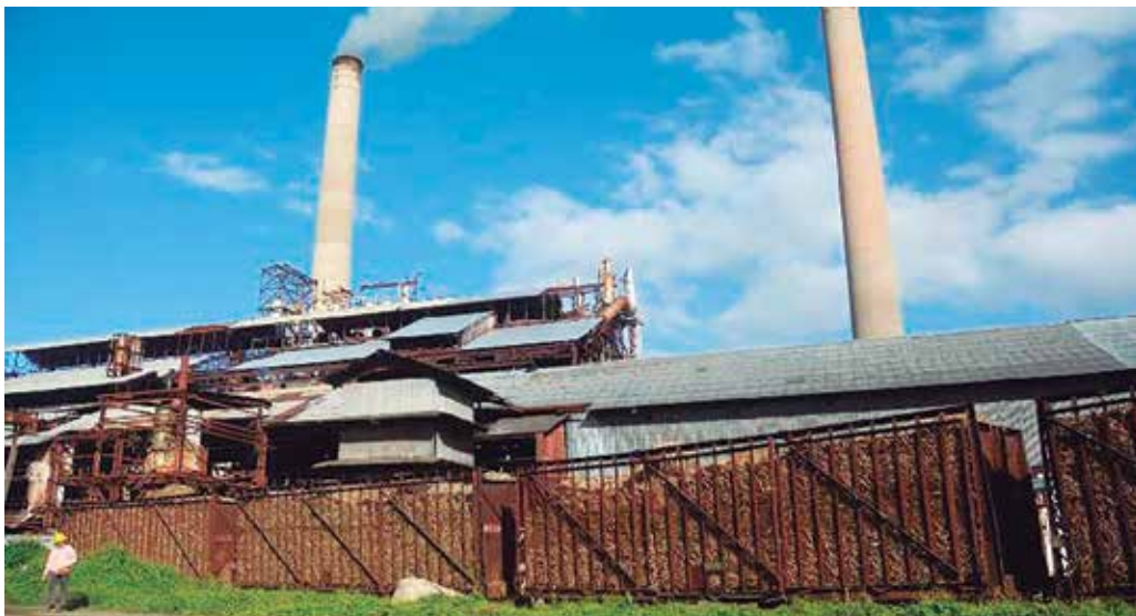
El ingenio taguasquense engrana, poco a poco, su maquinaria.

Para este sábado está señalado el acto nacional en el organopónico gigante Celia Sánchez Manduley, ubicado en el reparto Olivos 3 de la ciudad espirituana.