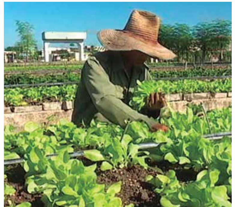
La provincia cuenta con 191 organopónicos, de ellos 60 semiprotegidos.

La fuente significó que parte de lo logrado obedece a la contribución de las granjas urbanas que han aportado la semilla y también de los productores que cosechan su propia simiente, pues hace años que el país no la puede importar. "Eso es lo que ha permitido que hace rato hayamos podido comercializar vege-