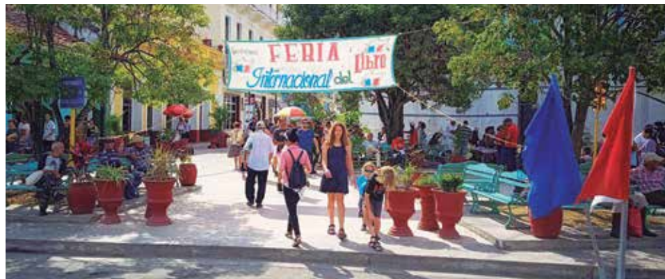
El capítulo espirituano de la Feria Internacional del Libro es siempre uno de los eventos más esperados.

“¿Que hay muchos escépticos e, incluso, detractores a quienes hay que enfrentar?, es cierto. Pero tengo la absoluta confianza de que con un trabajo sistémico se puede lograr”, concluyó el directivo.