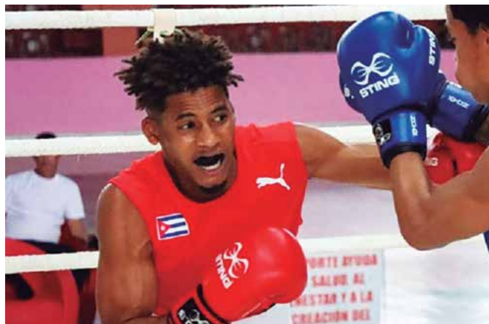
Uno de los resultados fue el título inédito del boxeo en el Torneo Nacional Playa Girón de enero pasado.

La ausencia de competiciones no fue sinónimo de pereza en Sancti Spíritus. De la mano de la iniciativa y las alternativas, el deporte participativo cobró cuerpo con la concepción de "virarse" para el barrio en una variante que pretende mantener en el año que se aproxima la esencia de la vitalidad de un sector llamado a estimular mucho más la creatividad para sostenerse en pie ante los fuertes rivales que le impone el actual contexto.