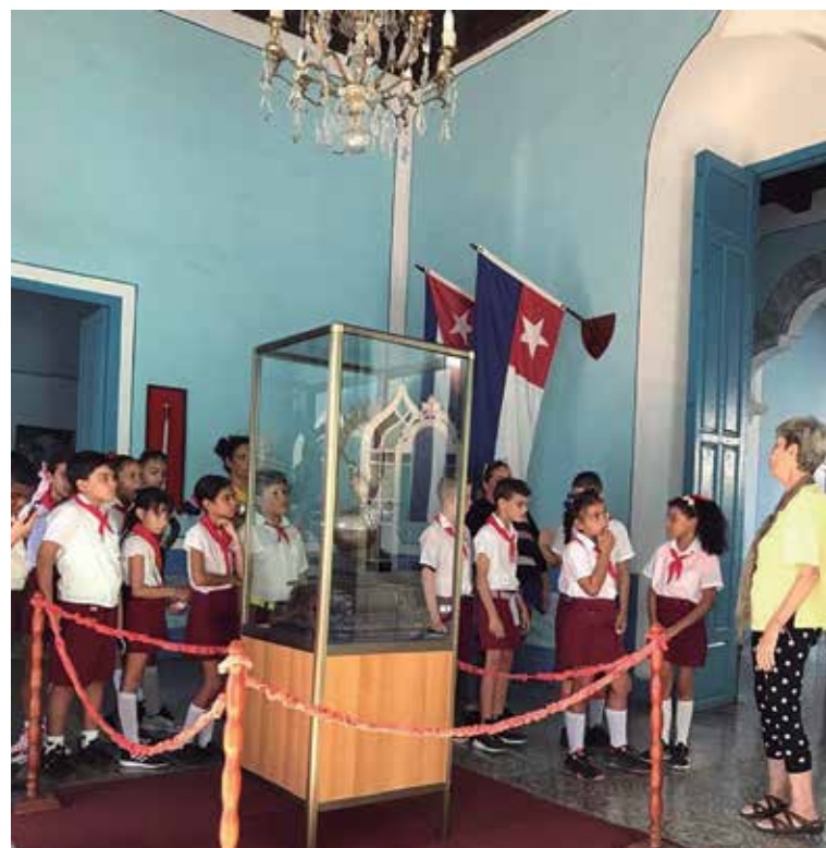
Transmite su pasión por el patrimonio a las nuevas generaciones.