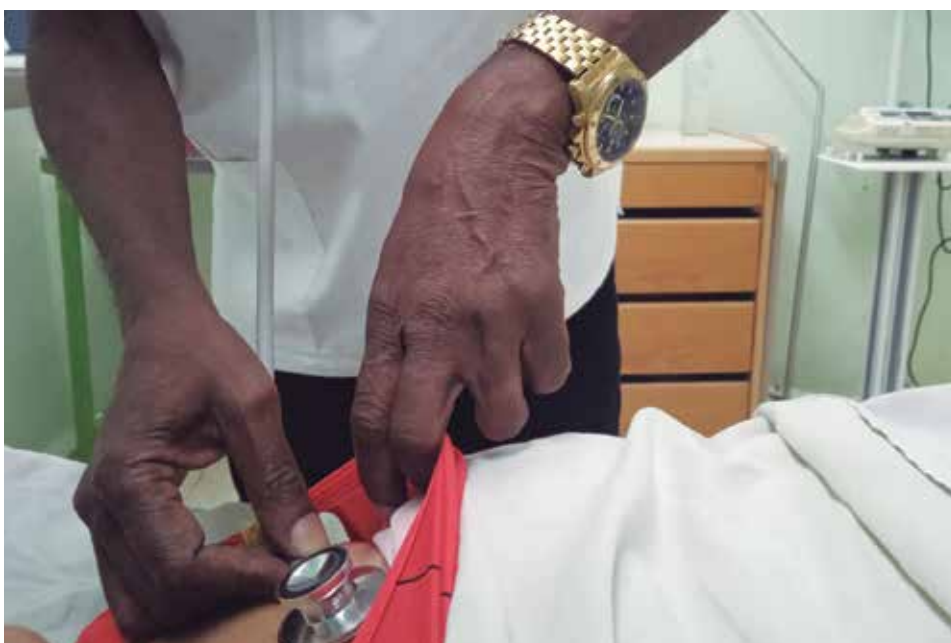
“El personal de Enfermería debe tener la suficiente habilidad y capacidad para hacer las cosas bien”, expresa.

“Nunca me voy a adaptar a ver morir a nadie, menos si es un joven o un niño. Hay quienes dicen que yo tengo ese don de dar amor porque hago lo imposible por devolverle la vida a esa persona en estado de gravedad, por acompañarla, aun cuando el desenlace sea fatal. La muerte duele siempre, nadie la acepta, aunque lidies todos los días contra ella”.