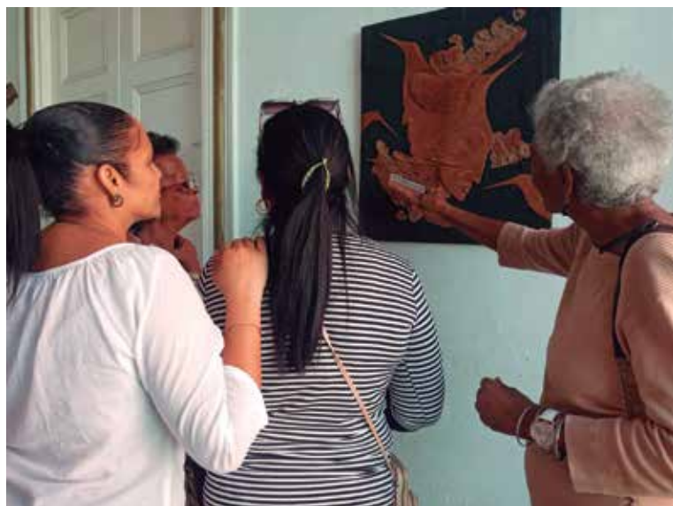
La Semana de la Cultura, oda a la espiritualidad de los trinitarios.