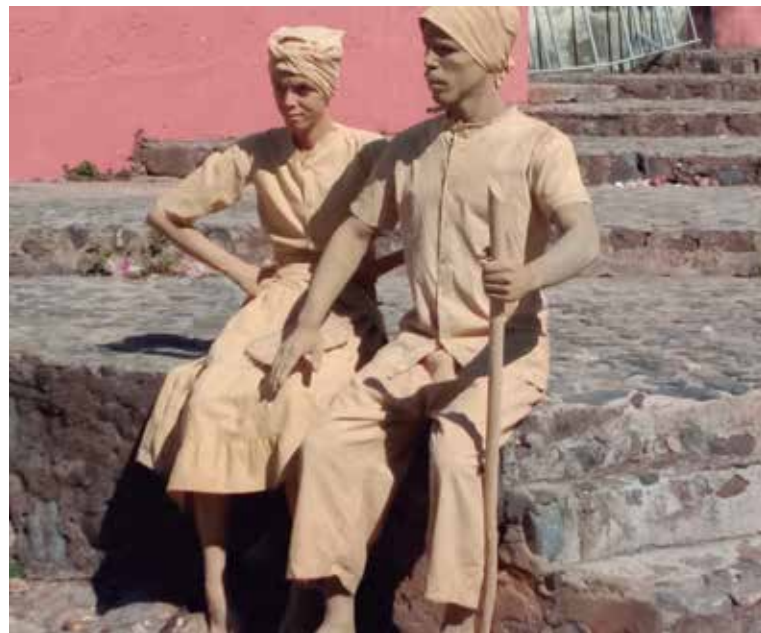
Trinidad es un escenario ideal donde florecen todas las manifestaciones del arte.

Museos, galerías y otras instituciones culturales, además de plazas y otros espacios públicos, se convierten en escenarios ideales en los que artistas y públicos se abrazan en este acto sublime para perpetuar la identidad cultural de la ciudad.