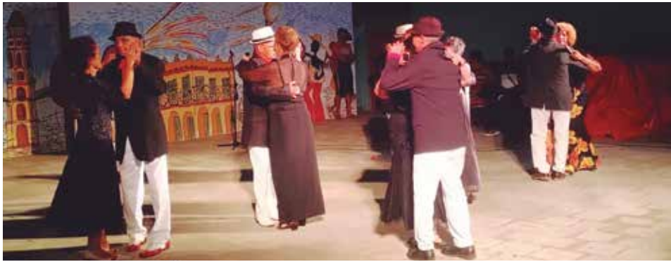
El talento local ha sido el protagonista de las actividades durante la 52 Semana de la Cultura Trinitaria.