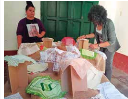
El Festival del Pañuelo Teresa Toscano In Memoriam resalta entre las propuestas de las festividades.