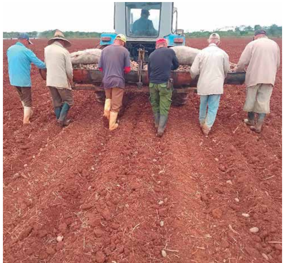
La Empresa Agroindustrial de Granos Valle del Caonao sembró 9.4 hectáreas de papa.

De igual forma, acotó, que el rendimiento planificado con el actual cultivo, previsto a cosechar entre marzo y abril, ronda las 20 toneladas por hectárea.