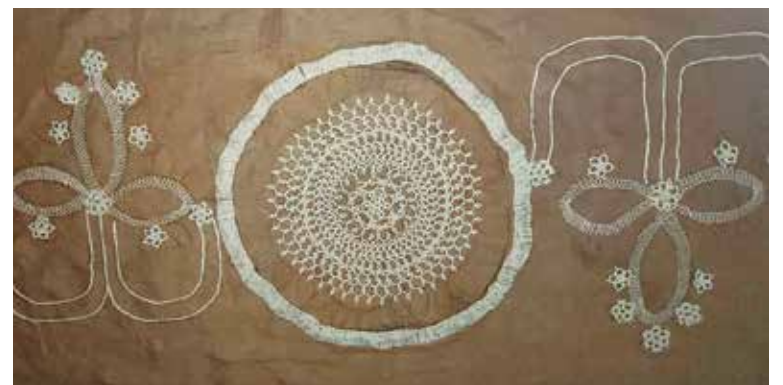
Las piezas de la muestra reflejan a escala natural los puntos y patrones de la lencería trinitaria.

“Son diseños abstractos de material blando, también creados por el colectivo de Entre hilos,