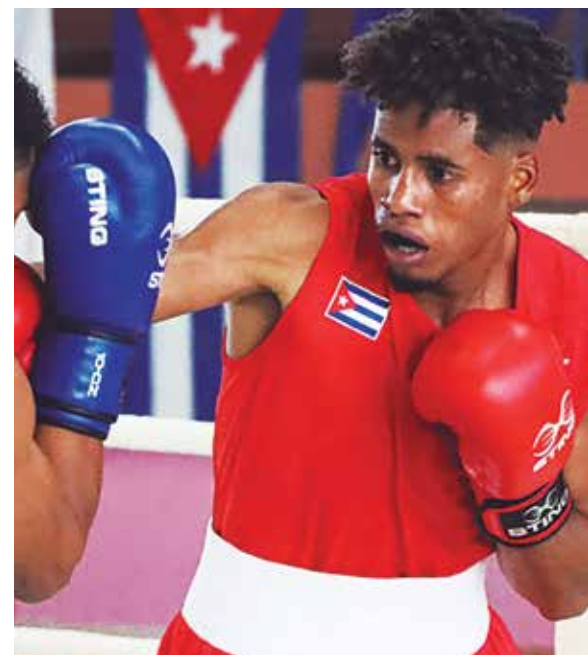
Esta será una nueva oportunidad para el crecimiento profesional del púgil sierpense.

Es aún bien temprano, tanto que el proyecto está casi en fase de calentamiento, pero será mejor tomarle el pulso en sus inicios para bien de la mente y el cuerpo de nuestros barrios y calles.