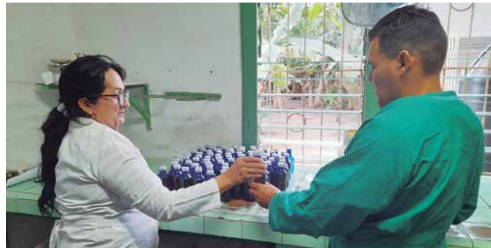
La especialista suma horas extras a la faena cotidiana para entregar elaboraciones con calidad.