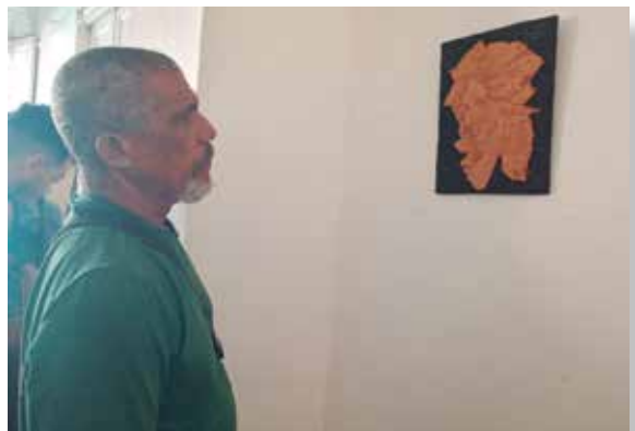
Las artes visuales son protagonistas de las actividades en esta edición de la Semana de la Cultura Trinitaria.