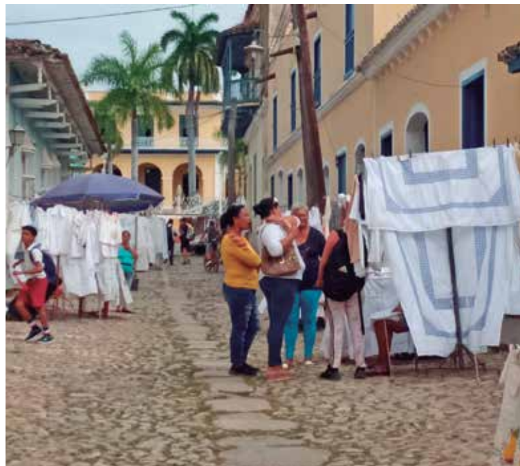
La ciudad es un escenario ideal para disfrutar la cultura en todas sus manifestaciones.