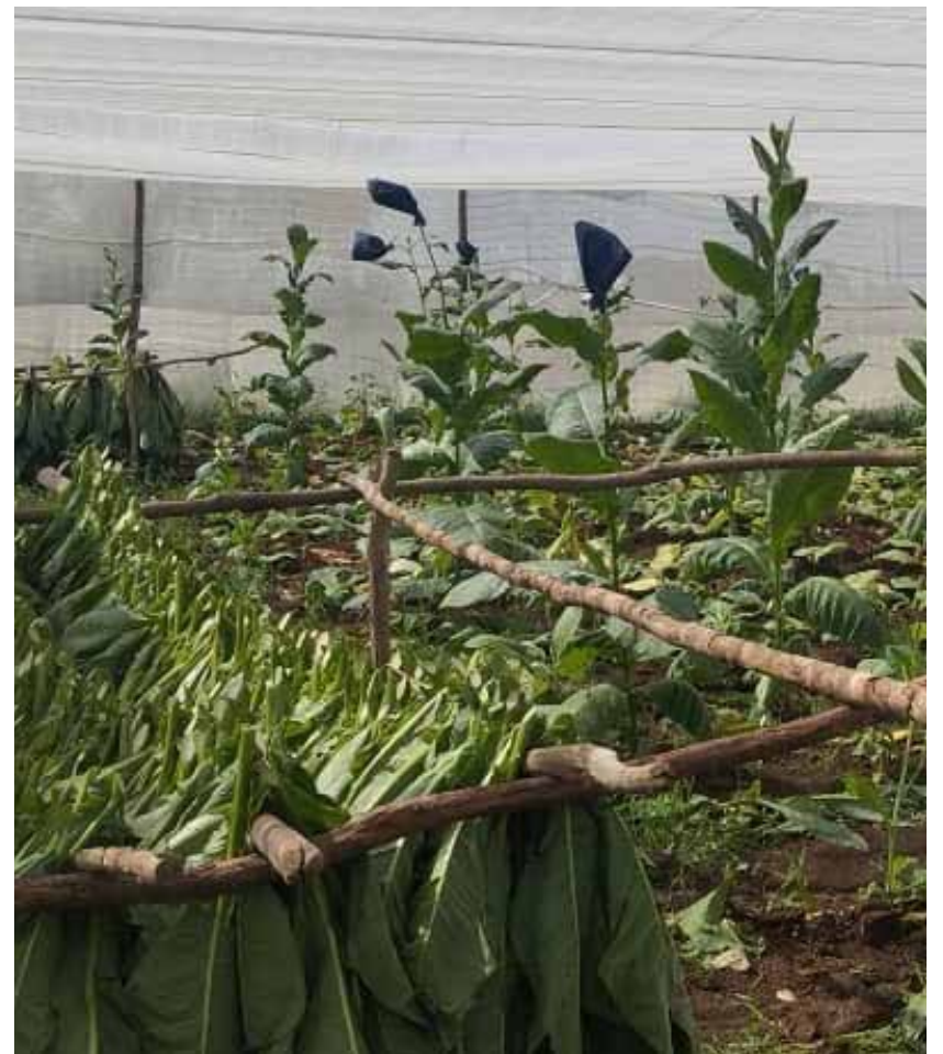
La entidad vela por la calidad de las vegas en la región central de Cuba.

Sin escapar al déficit de recursos e insumos, la Estación preserva el único banco de germoplasma de tabaco negro existente en la Mayor de las Antillas y uno de los más acaudalados de Latinoamérica al disponer de cerca de 900 variedades, algunas rústicas que atesoran la génesis del tabaco en Cuba.