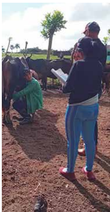
El vínculo de los estudiantes con la práctica resulta fundamental.

“Existe gran compromiso y motivación, por lo que consideramos que muchos serán los frutos de la ETP para este 2025”, puntualizó finalmente.