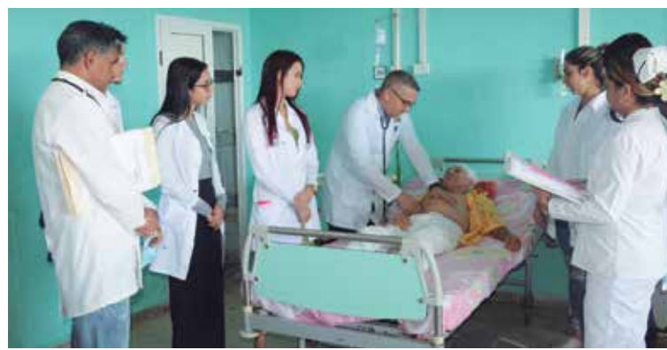
La atención al paciente figura entre las prioridades del servicio.

¿Cuánto aportan las investigaciones en la práctica diaria del servicio?