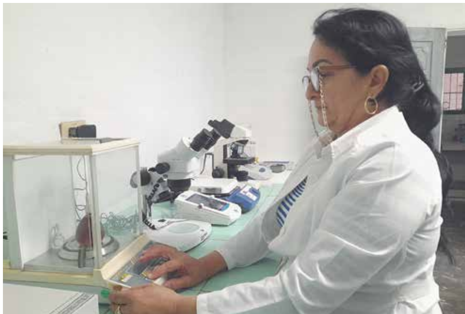
Por más de cuatro décadas esta profesional se ha mantenido en la red de farmacias del municipio.

pactados en un 109 por ciento, cifra traducida en 838 329 frascos de diferentes medicamentos a disposición de los cabaiguanenses. Mantuvimos el ritmo a pesar de la ausencia de materias primas básicas para la manufactura de preparados hechos a base de mentol y de petrolato líquido y sólido”.