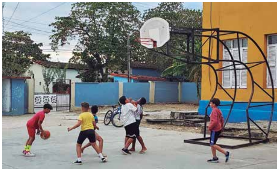
El propósito es extender las actividades deportivas a toda la geografía del territorio.