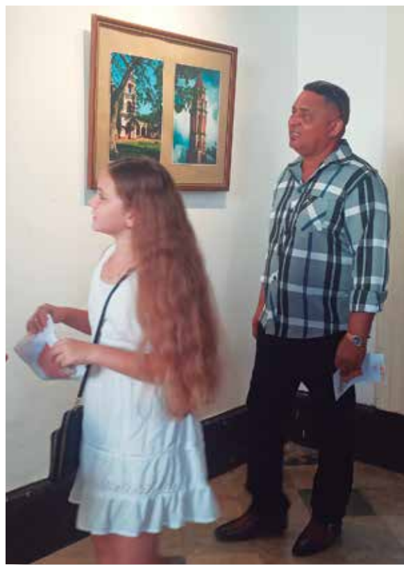
Varios espacios culturales acogen las actividades que realzan las tradiciones de la tercera villa de Cuba.