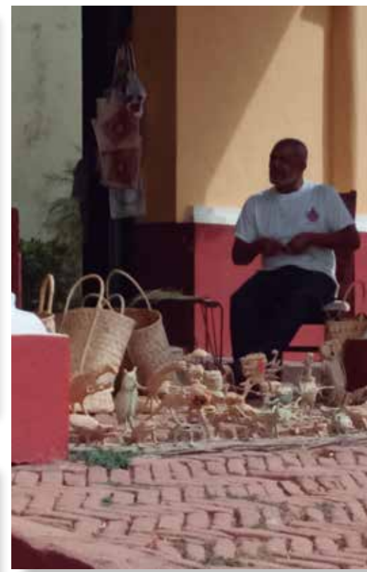
A los títulos de Ciudad Artesanal y Ciudad Creativa se dedican los festejos este año.