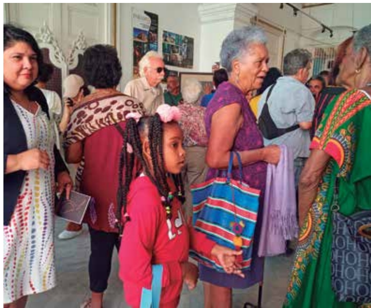
Público y artistas, una conexión imprescindible para el éxito de las actividades.

Instituciones culturales y los propios espacios públicos de la ciudad acogen las actividades dedicadas a resaltar las tradiciones que perduran en esta urbe patrimonial