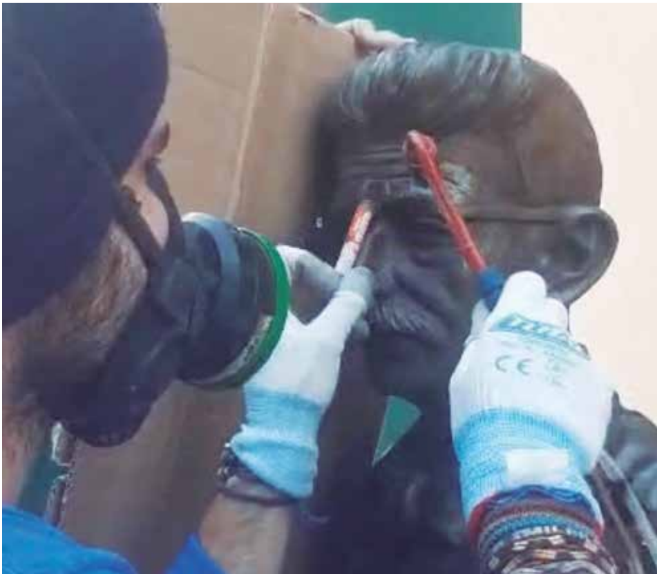
El deterioro de los espejuelos ha obligado a realizar intensas acciones de restauración.