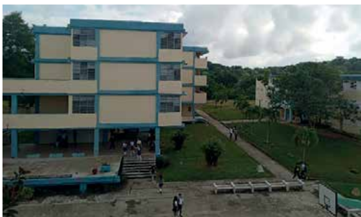
En el Centro Provincial de Entrenamiento para Concursos del IPVCE Eusebio Olivera se desarrollarán diversas acciones constructivas.

También la Dirección General de Educación en el territorio tiene prevista la construcción de tres casitas infantiles, distribuidas en los municipios de Sancti Spíritus, Trinidad y Taguasco, instalaciones que acogerán a 75 niños de madres trabajadoras y casos sociales.