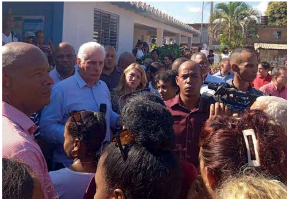
El intercambio directo con el pueblo es una de las premisas de los recorridos.

“Aprovechamos los recursos endógenos como concepto de economía circular. Por ejemplo, la ausencia de los paquetes tecnológicos la suplimos con el tratamiento de los desechos de nuestros animales”, explicó durante el recorrido con el Presidente por gran parte de su finca, donde, además de sembrados, se disfrutaron de sólidas naves