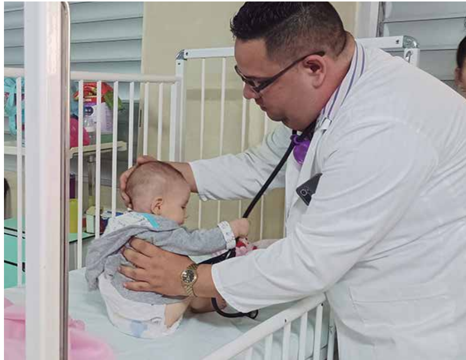
En el Pediátrico espirituario, profesionales de alta calificación garantizan la atención médica a todos los pacientes ingresados.