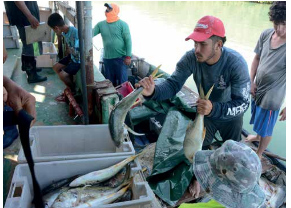
Varios jóvenes intervienen en el proceso de captura en Tunas de Zaza.