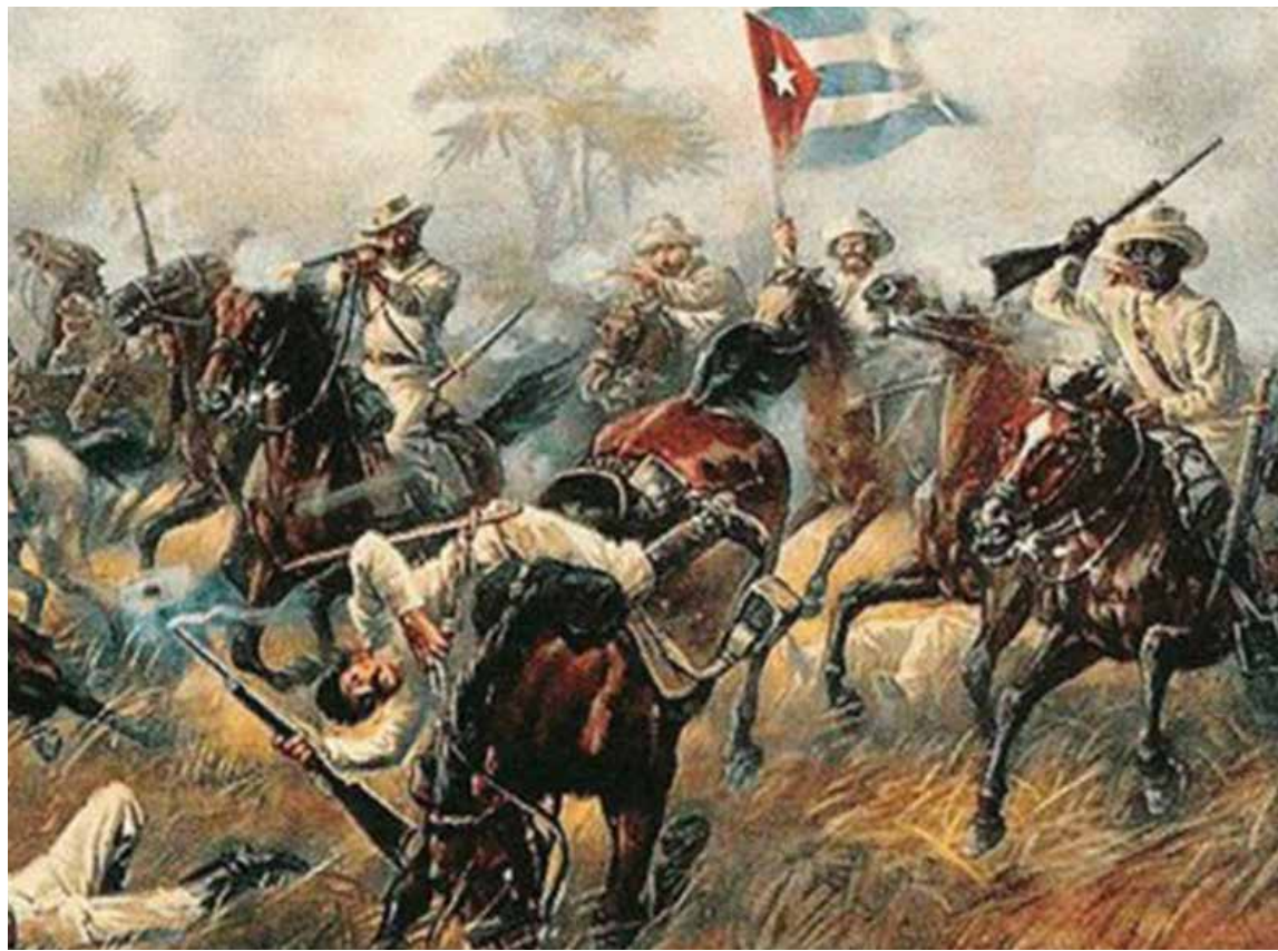
El 24 de febrero de 1895 se reinició la lucha por la independencia de la isla.