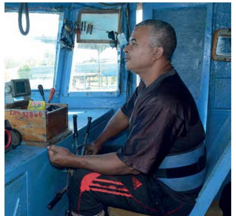
El patrón de la enviada lleva toda la responsabilidad durante el proceso.

Un soplo de brisa en el rostro de los tripulantes indica que cambiarán los vientos rumbo norte, nadie como ellos para avizorar tormentas, estar a la defensiva y recoger pita antes de que los agarre un mal tiempo en medio del mar; en busca de peces pasan todo el año, incluso acopian las capturas de algunos pescadores privados que se subordinan a la cooperativa de Episan para trasladarlas bien nevadas a la industria, cada número cuenta en su plan de producción que se basa, precisamente, en el servicio de traerlo todo y en buen estado.