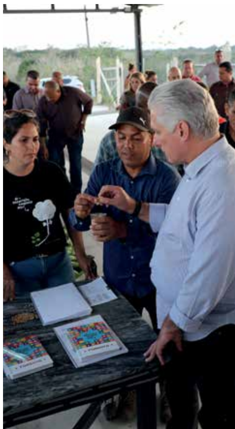
Díaz-Canel apreció los resultados productivos de la Finca La Anguila.

Fue ese el principal llamado que dejó a su paso por esta tierra el Presidente de la República, consciente de que es la más efectiva estrategia para garantizar la gran misión histórica: “Defender y preservar la Revolución”.