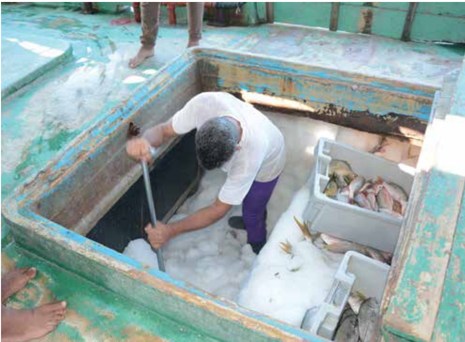
Esta es una labor de mucho sacrificio, que requiere de días y noches en medio del mar.