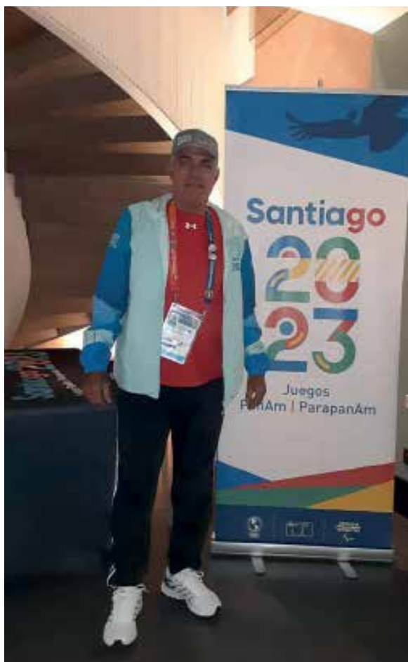
En su carrera como árbitro ha participado en importantes eventos internacionales.