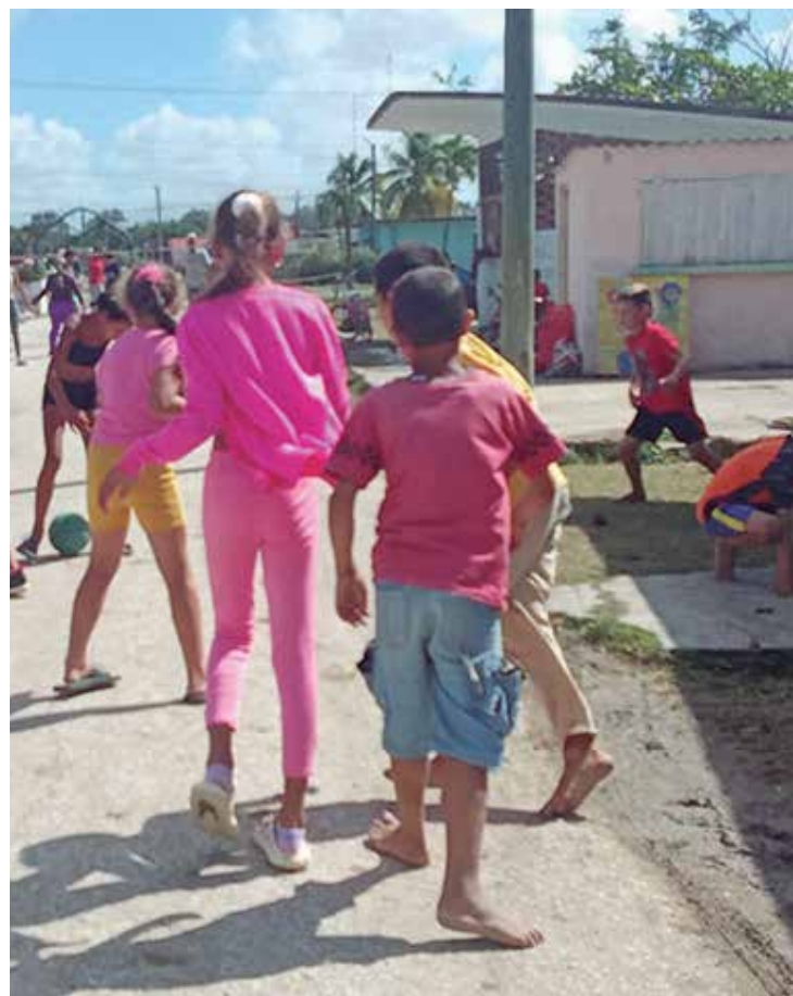
Yaguajay será la sede de las actividades centrales de la provincia por el cumpleaños de la institución.

A la hora en que supo de su elección como mejor árbitro internacional de la provincia, sintió el mismo efecto de un disparo de 10, a sus 63 años, ahora en la EIDE Lino Salabarría: "Es un reconocimiento que a uno lo estimula a trabajar más".