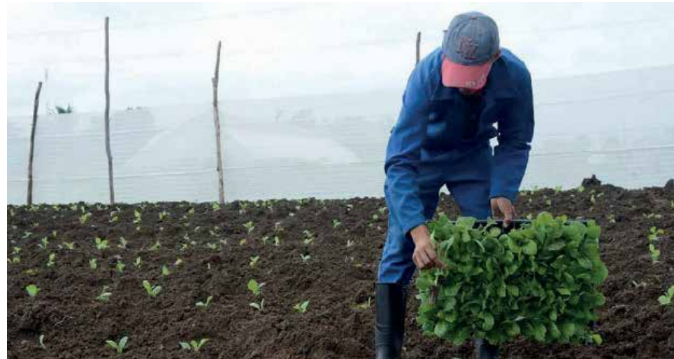
En la provincia se plantaron 1320.29 hectáreas de tabaco, la mayor parte de la modalidad sol en palo.

También sucedió que la contratación se fue haciendo casi sobre la marcha, debido a que los incentivos en MLC para los productores, principalmente de sol en palo, llegaron ya en plena campaña. “Comenzamos a sembrar y aún estábamos contratando tabaco, incluso cerramos el año haciendo contratos porque se les dio la posibilidad a todos aquellos productores que quisieran sembrar tabaco, sobre todo sol en palo. Como es lógico, el crecimiento está basado en la estimulación que se le buscó al tabaco sol en palo, o sea, el derecho de los productores a la compra del MLC a partir de que logren dos aspectos fundamentales: cumplir con el contrato de siembra y lograr como mínimo una tonelada por hectárea de rendimiento agrícola. A partir de ahí, a todo el tabaco que compone precio,