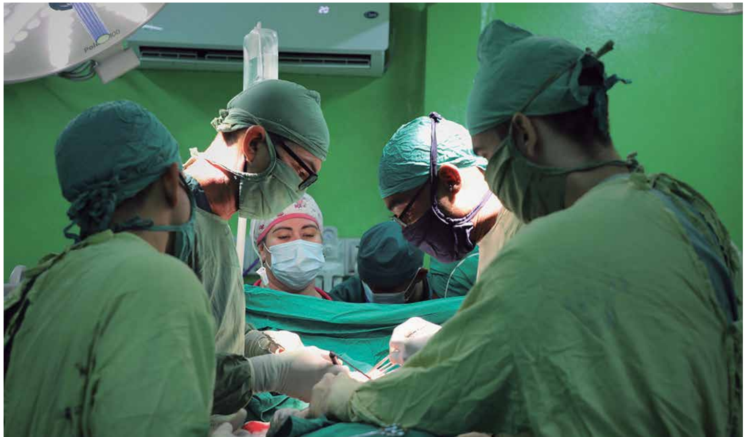
La operación practicada confirmó el desarrollo alcanzado por la cirugía pediátrica espirituaña.

“Dichas malformaciones —agregó— en algunos casos muestran un crecimiento acelerado en los primeros dos años de vida; des-