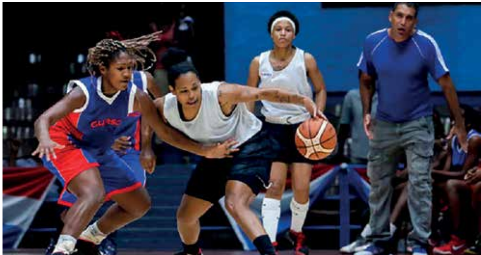
La presencia femenina regresa a la liga luego de dos años de inactividad.

Esta variante fue la que encontró la comisión nacional para revivir el evento en un contexto donde buena parte de las atletas dejaron de practicar el deporte por la falta prolongada de competencias y otras por estar contratadas en el exterior.