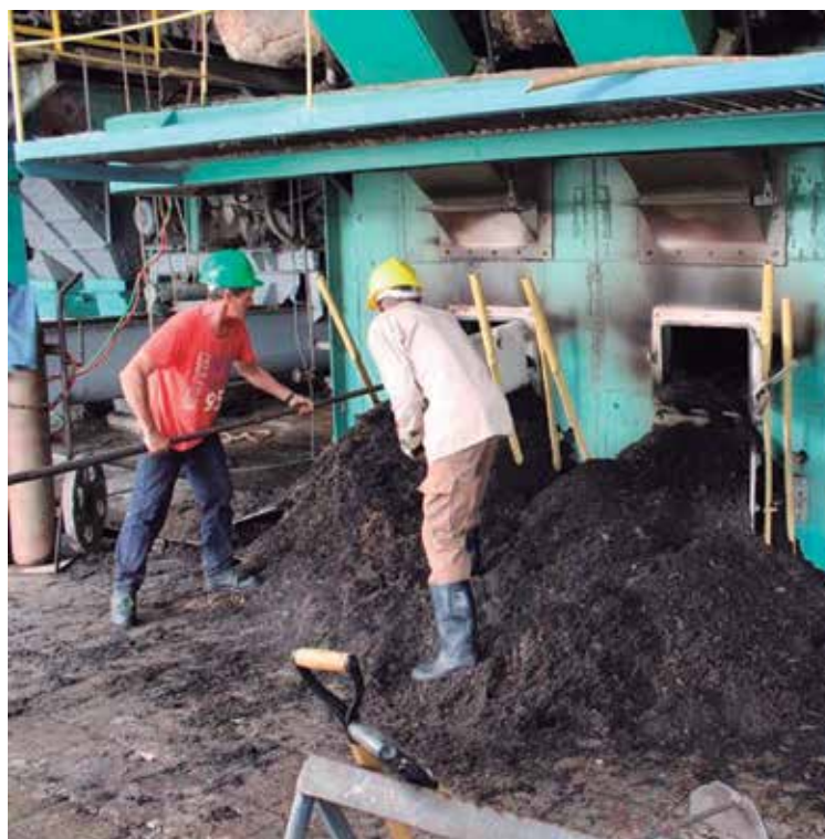
La eficiencia es uno de los temas de análisis en la conferencia de los trabajadores espirituanos.

Desarrollamos en el 2024 el análisis en los colectivos laborales sobre cómo enrumbar la economía desde la corrección de distorsiones con el fin de buscar consensos en de qué manera recuperar capacidades productivas y de servicios que