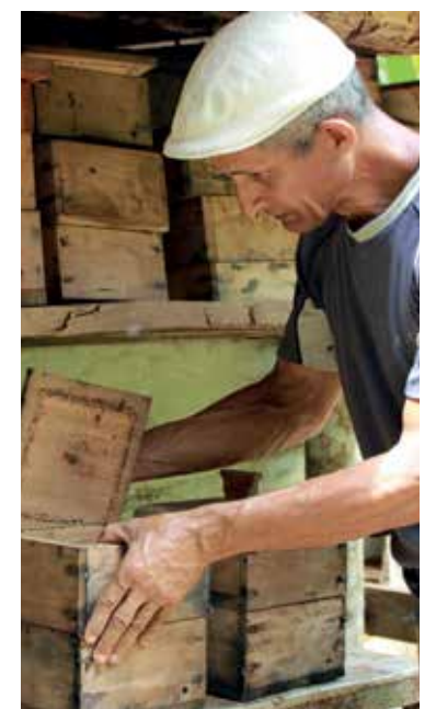
Entre los resultados figuran incrementos en la producción de miel.

En el proyecto Cobimas se involucran trabajadores de la Empresa Flora y Fauna, quienes establecen alianzas con productores de las bases productivas Luis La O, Antonio Maceo, Primero de Enero y Diez de Octubre.