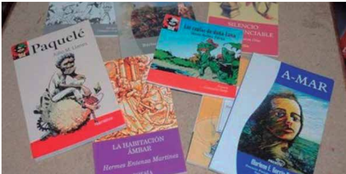
El stand de Luminaria en la Feria Internacional del Libro de La Habana permitirá visibilizar los 25 años de existencia de la casa editorial.