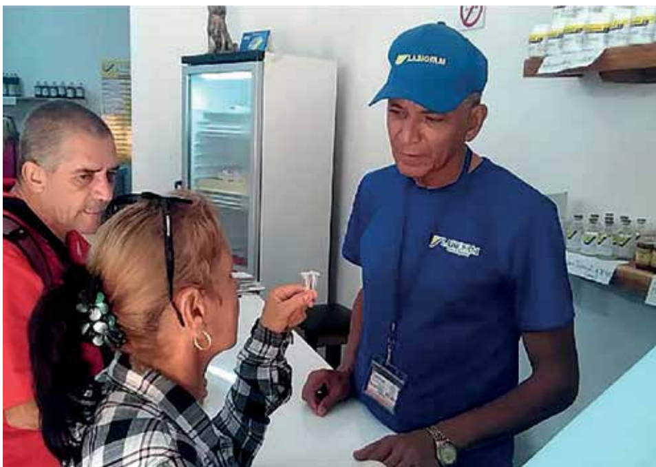
La empresa recaudó por concepto de ventas más de 58 millones de pesos.

La entidad espirituana incorpora otros surtidos y realiza encadenamientos productivos con nuevas formas de gestión no estatal