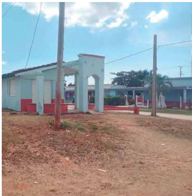
El reparto Félix Salabarría, construido por la Revolución, en la mira este año del programa de transformación de comunidades en Trinidad.

Alrededor de 3 000 habitantes de estos asentamientos recibirán los beneficios de diferentes labores que ofrecen soluciones a planteamientos como el abasto de agua, el mal estado constructivo de inmuebles, el saneamiento ambiental y otras problemáticas