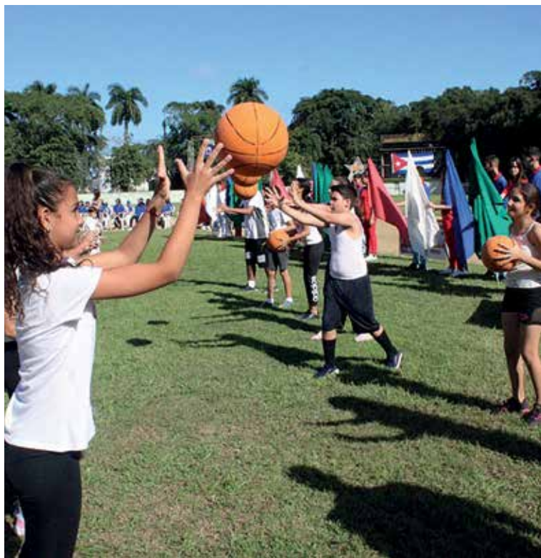
Estimular la práctica deportiva desde la base es un desafío para el sector en Sancti Spíritus.

Mientras eso no ocurra, la familia deportiva seguirá sentada en el mismo asiento de la inconformidad de este balance que dejó abiertas todas las puertas para que ventilen los pulmones del deporte y reviva a tono con su esencia.