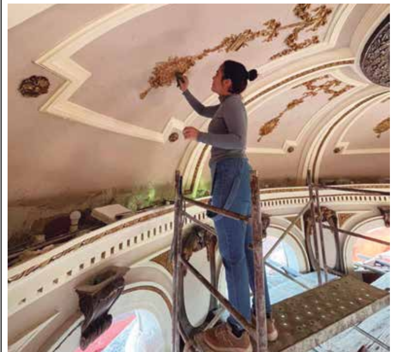
Las labores de restauración exigieron de grandes esfuerzos por la altura de la cúpula.